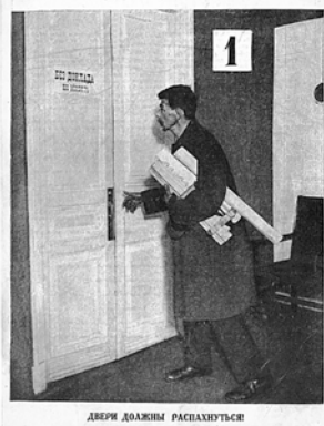
ДВЕРИ ДОЛЖНЫ РАСПАЗНУТЬСЯ

Первый номер журнала «ИЗОБРЕТАТЕЛЬ» открывает статья Альберта Эйнштейна «Массы вместо единиц», где великий ученый говорит, что время гениальных изобретателей-одиночек прошло, наступает замечательная эпоха коллективного изобретательства. В этой январской книжке новорожденного издания блистательный подбор авторов. Со статьями выступают крупные государственные и партийные деятели — В.Куйбышев, Л.Каменев, замечательные писатели — М.Пришвин, В.Шкловский, Н.Погодин, знаменитый журналист М.Кольцов, академики, выдающиеся инженеры и простые рабочие. Печатается бюллетень важнейших государственных решений по изобретательским делам, в том числе о привилегиях, помогавших тогдашним изобретателям жить и заниматься творчеством.