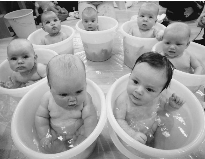
Сейчас средний размер алиментов составляет 1600 рублей. Сумма невелика