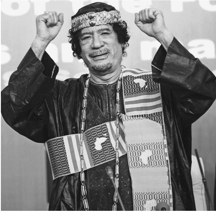
Полковник всегда расстраивался из-за скандалов, задевающих честь его семьи

Утечки WikiLeaks подтверждают: клан Каддафи контролирует нефтегазовую отрасль, сферу телекоммуникаций, строительный сектор и многие другие. А зарубежные банковские активы семьи лидера ливийской революции составляют 32 миллиарда долларов. Но дружбы и согласия среди его детей не было и нет →05