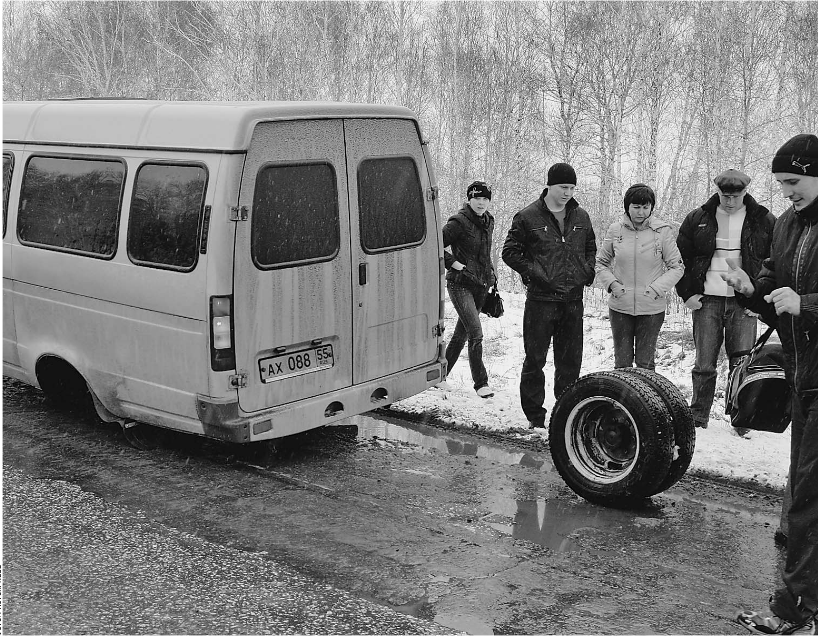
Техническое состояние маршрутных такси все чаще становится причиной ДТП

Штрафы за нарушение правил перевозок пассажиров ужесточат в сотни раз