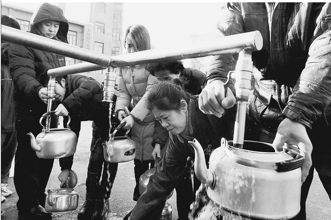
В китайском Харбине вода уже стала дефицитом

Хабаровский край уже в ближайшие дни ожидает экологическую катастрофу. Сегодня на заседании специальной комиссии краевого правительства будут определены возможные сроки введения в регионе режима чрезвычайной ситуации. Уже 1—3 декабря вода, отравленная аварией на одной из китайских фабрик, спустится вниз по течению на территорию России. В зоне возможного поражения проживает около полутора миллионов российских граждан. Такой паники, которая возникла в китайском Харбине, в Хабаровске еще нет, однако вся питьевая вода раскуплена не только из городских магазинов — ее нет даже на оптовых складах. Горожане уже делают запасы и скупают в магазинах все, что можно пить.