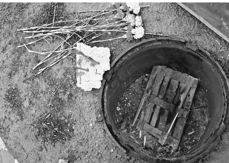
К месту гибели школьников красноярцы приносят цветы