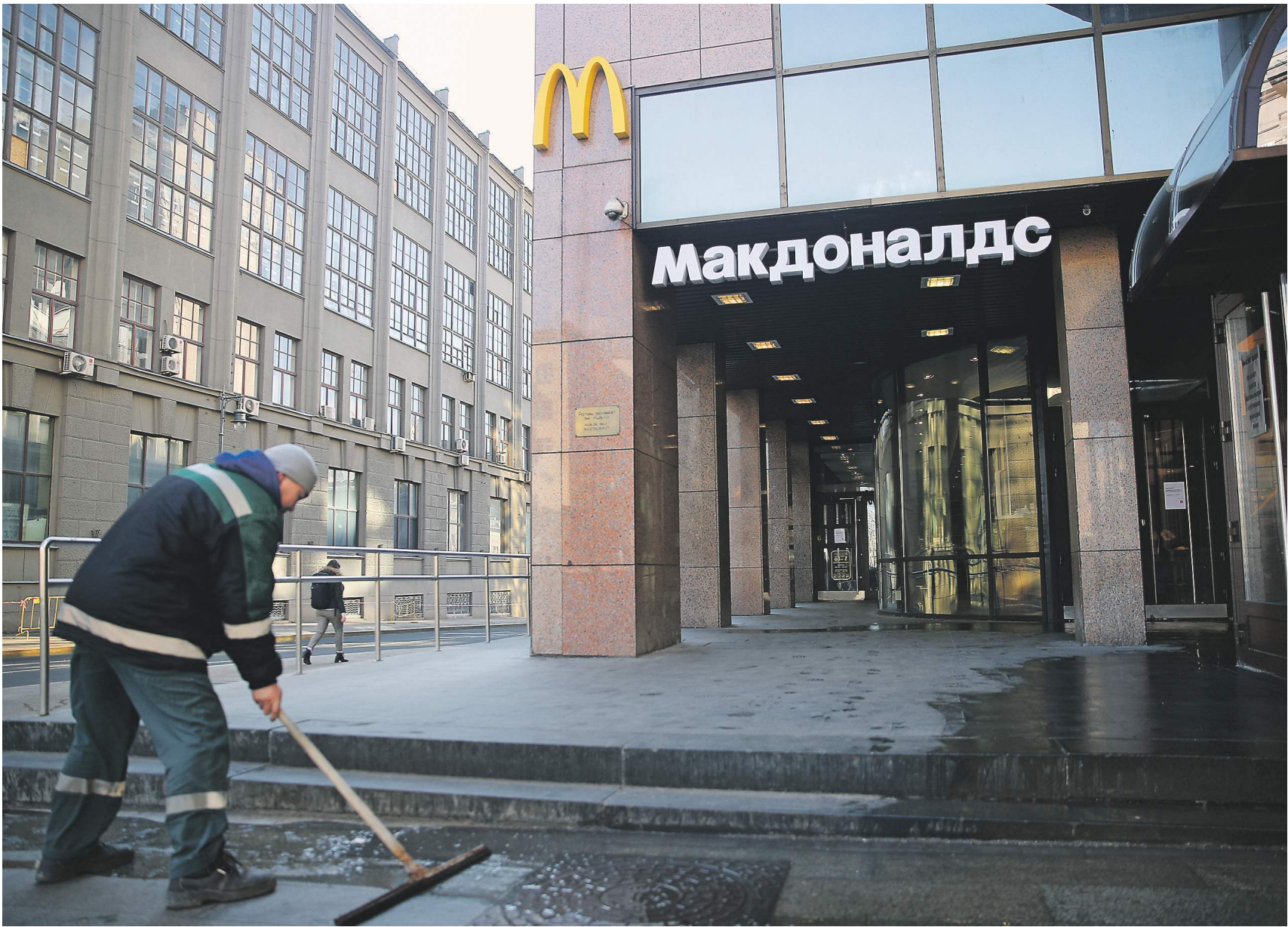
Зураб Джанашия / «Известия»