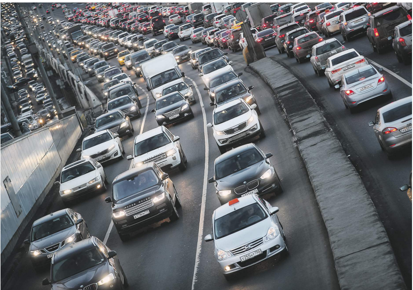
Зураб Джанашия / «Известия»