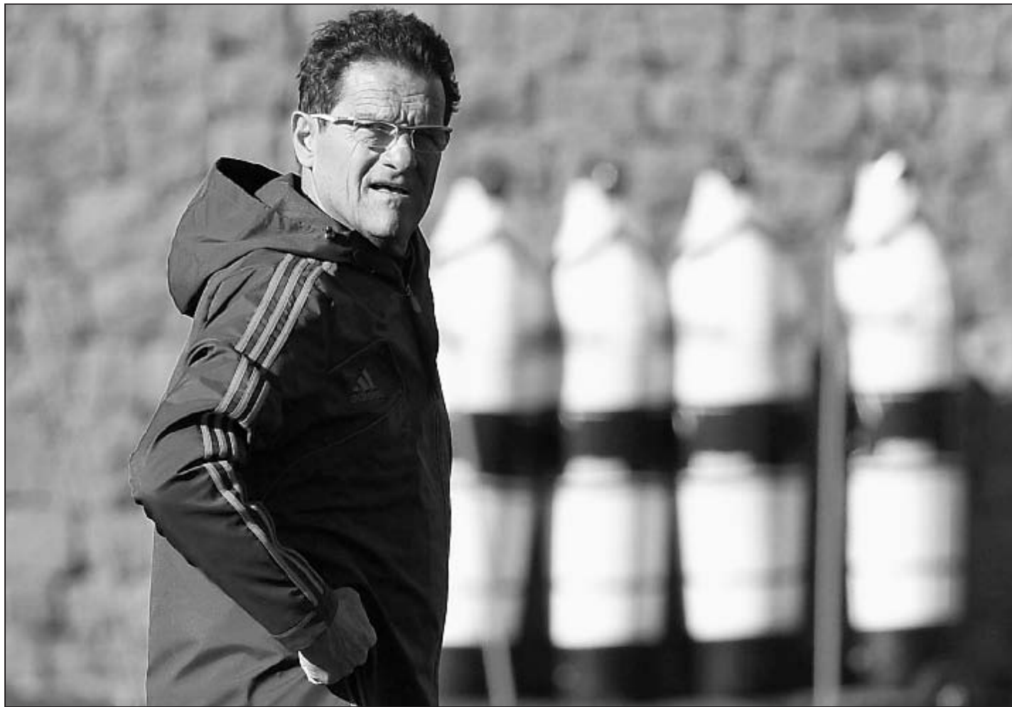
Александр ПРОХОРОВ «СЭ»