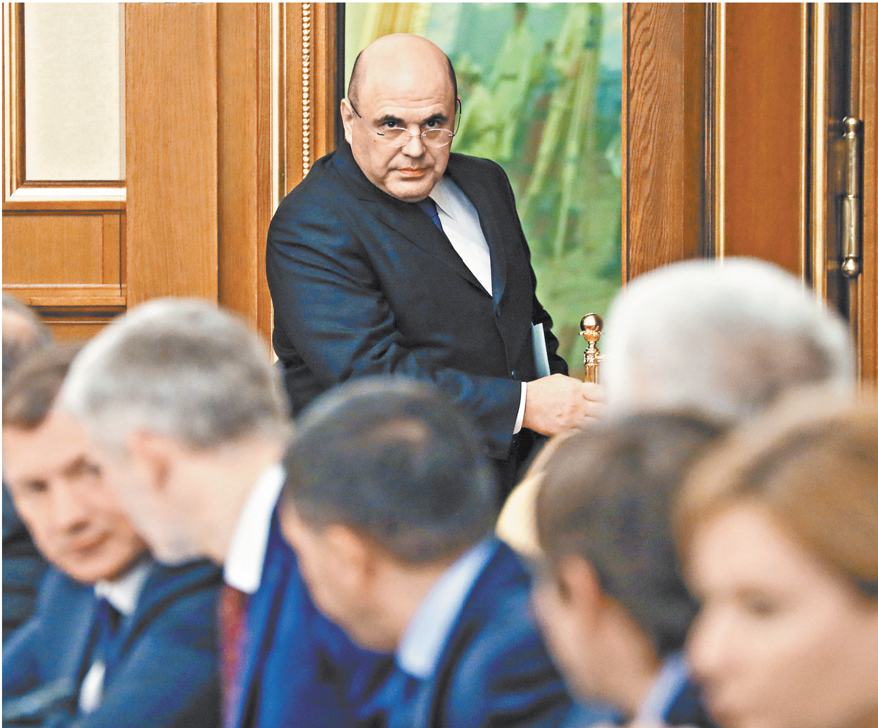
ДМИТРИЙ АСТАХОВ / РОИ / ТАСС