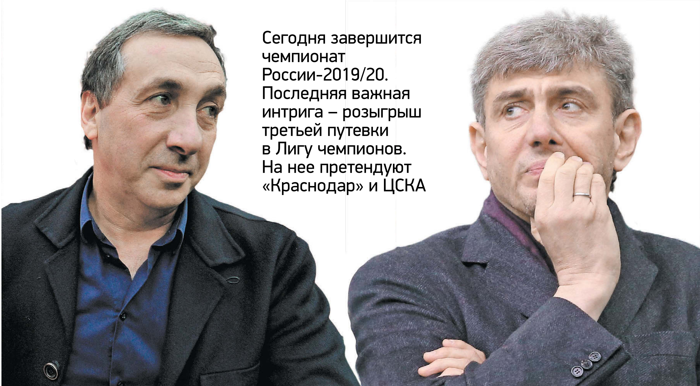
Президент ЦСКА Евгений Гинер