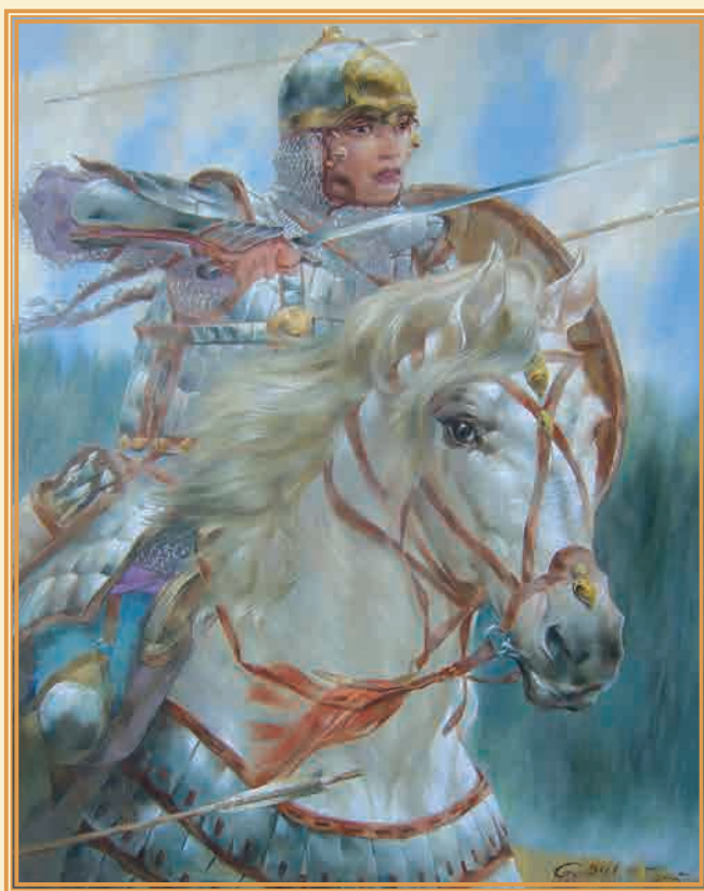
Порыв 2005 г. ▲

Город всё же пал, девушки погибли в сражениях. Там их и похоронили, а место захоронения называется теперь «Кызлар зираты» («Девичье кладбище»). В болгарских легендах о девушках-воительницах дочь болгарского хана часто носит имя Алтынчеч (Златовласка). В одной из легенд, преследуемая врагами, она замуровывает себя и все сокровища ханской казны в пещере. Девушка не умирает и до сих пор охраняет вход в пещеру. Её возвращение в народном сознании связывается с возрождением Булгарской земли. Образ Алтынчеч – символ несгибаемой воли народа, надежды на возрождение.