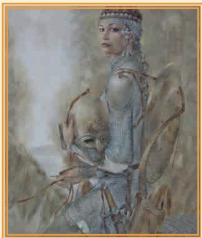
Утро 2003 г. ▲