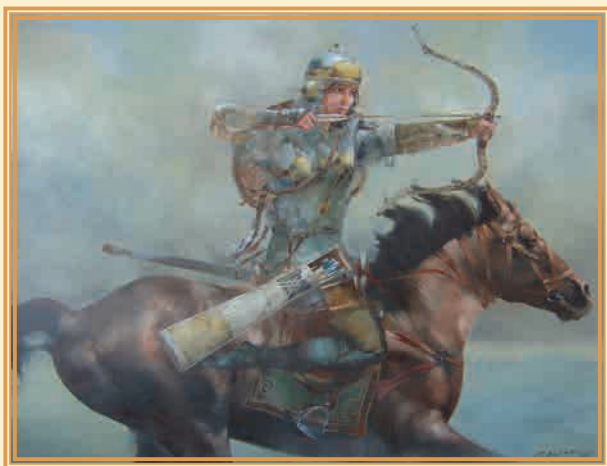
Выстрел 2005 г.