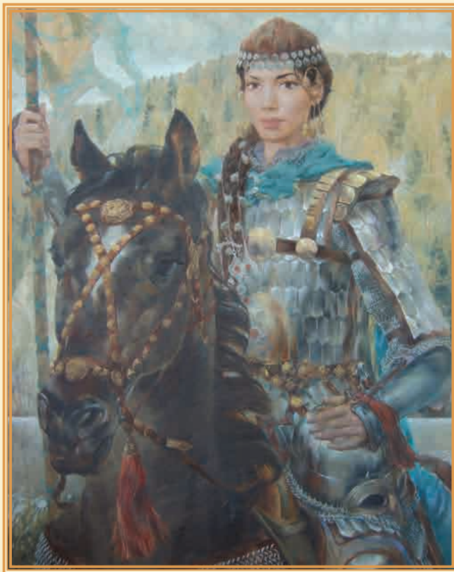
Выезд 2004 г. ▲