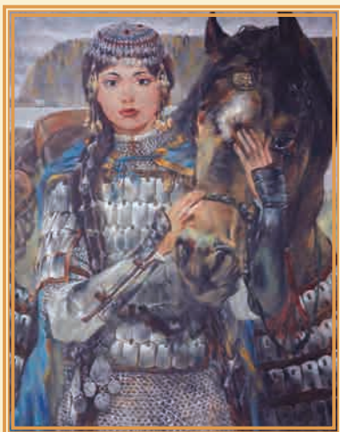
Ожидание 2003 г. ▲