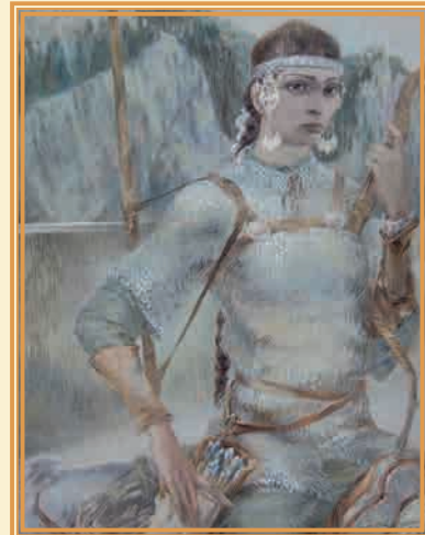
Агидель 2000 г. ▲