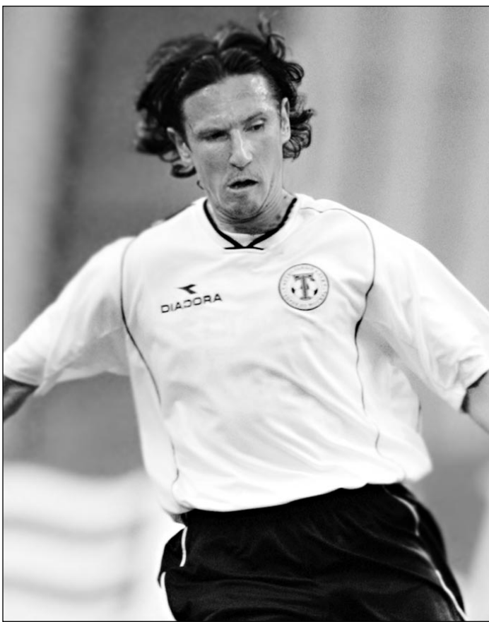
Фантазия, которая скоро может стать реальностью.