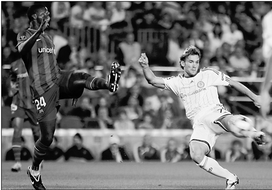
Вторник. Барселона. «Барселона» - «Динамо» К - 2:0. В атаке Андрей ШЕВЧЕНКО.

«Дни, когда они появились на свет, считаю самыми счастливыми в жизни. И оба раза на следующий день я забывал! Когда родился Джордан, «Милану» предстояла игра в Генуе с «Сампдорией». Вся ночь не спал, под утро ребенок родился, я убедился, что все в