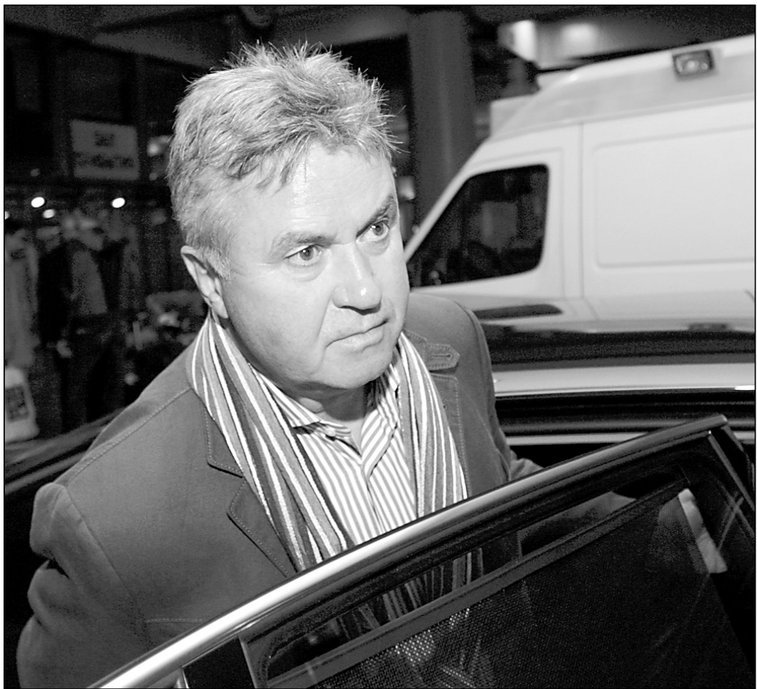
Вчера. Шереметьево. Гус ХИДДИНК.