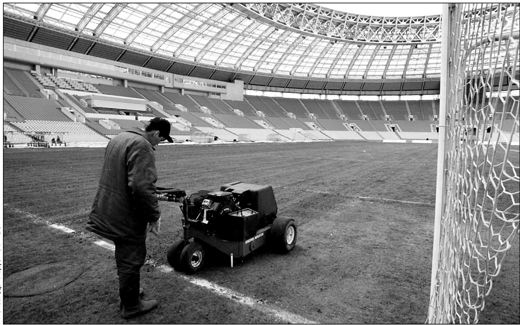
Вчера, Лужники. Работники стадиона делали все, чтобы сегодня главная арена страны смогла достойно принять сразу два матча чемпионата России.