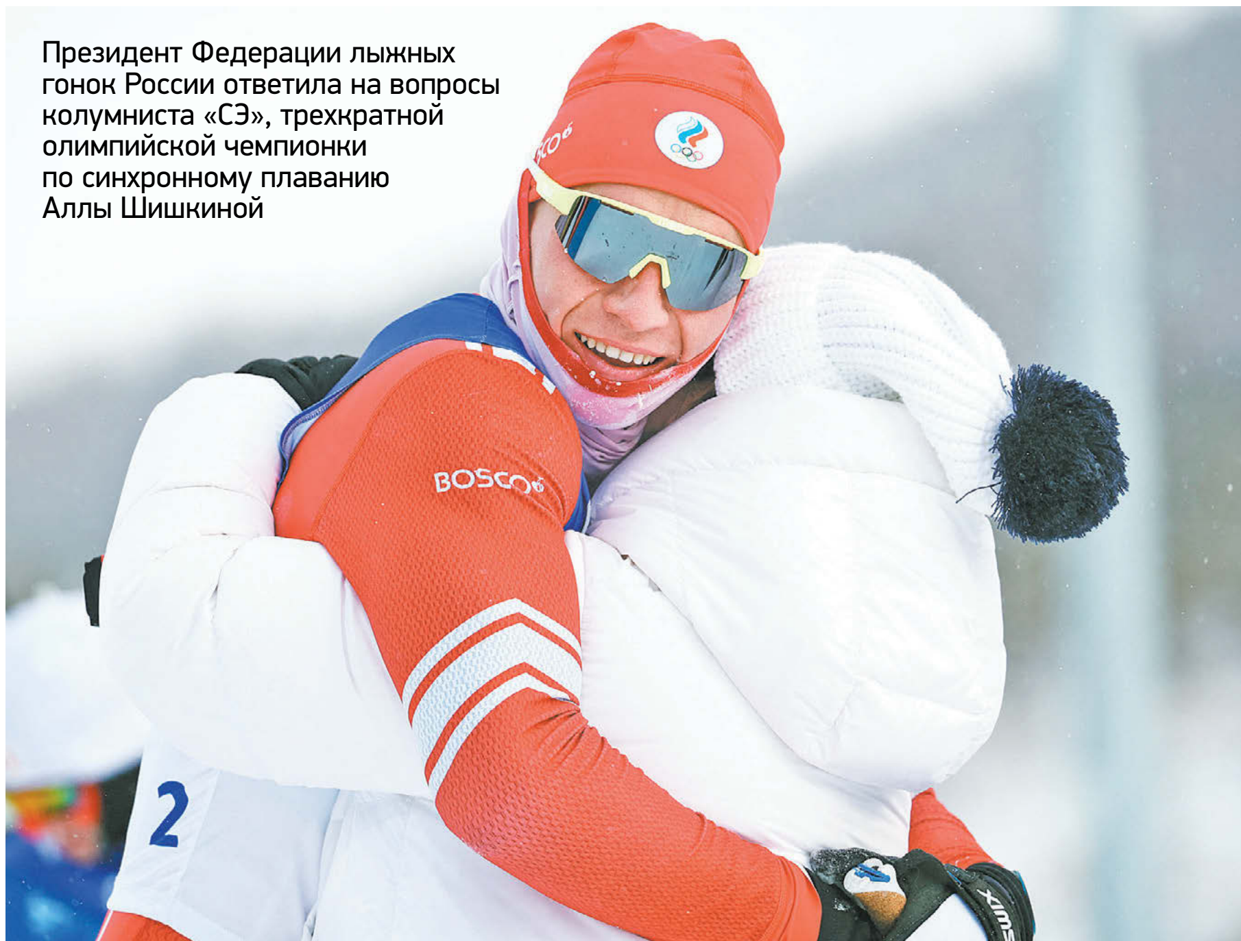
19 февраля 2022 года. Чжанцзякоу. Елена Вяльбе и Александр Большунов после масс-старта, на котором Большунов взял свое третье золото на этой Олимпиаде

Президент Федерации лыжных гонок России ответила на вопросы колумниста «СЭ», трехкратной олимпийской чемпионки по синхронному плаванию Аллы Шишкиной