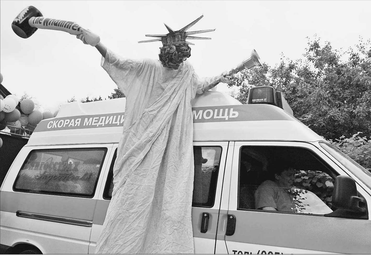
То, что зарубежная медицина гораздо сильнее российской, — миф

Прежде лечиться за границей могли партийные бонзы да супер- богатые люди. Теперь теоретически такую возможность имеем мы все, хотя практически она по-прежнему доступна немногим. Но и то хлеб.