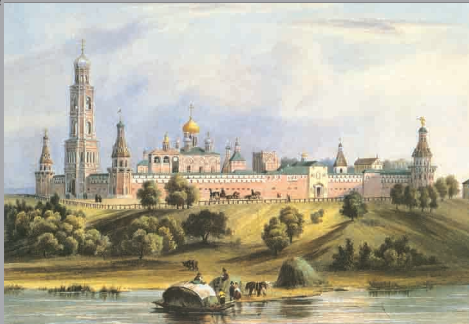
ВИД СИМОНОВА МОНАСТЫРЯ ОТ МОСКВЫ-РЕКИ. С ЛИТОГРАФИИ Л.-П. БИШБУА. АКВАРЕЛЬ. КОНЕЦ 1880-Х ГОДОВ