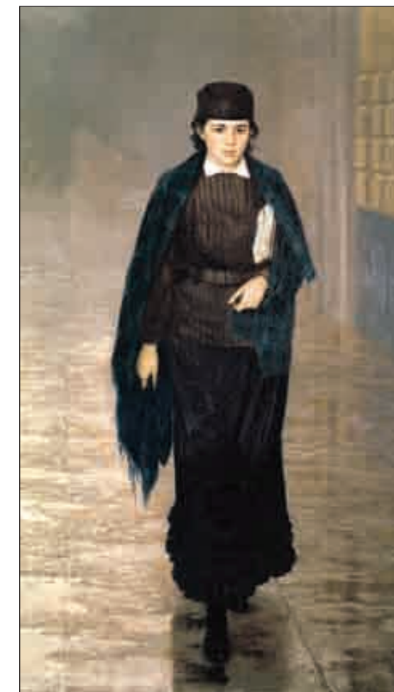
Н. А. Ярошенко. Курсистка. Холст, масло. 1883 год