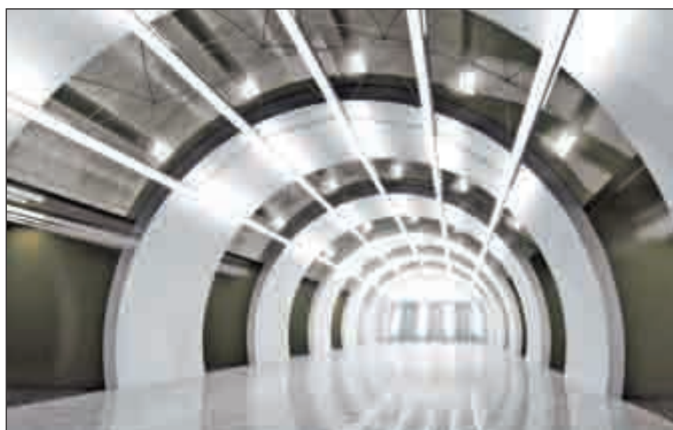
Московский метрополитен: взгляд в будущее