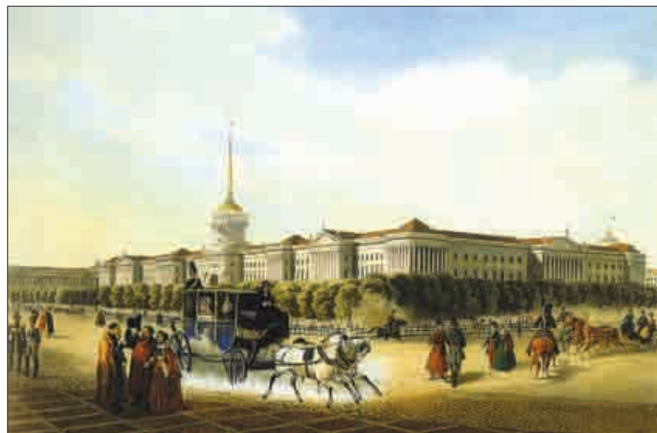
По страницам Адмиралтейского регламента Петра Великого (1722)

Московский журнал. История государства Российского. № 8 (248). Август 2011