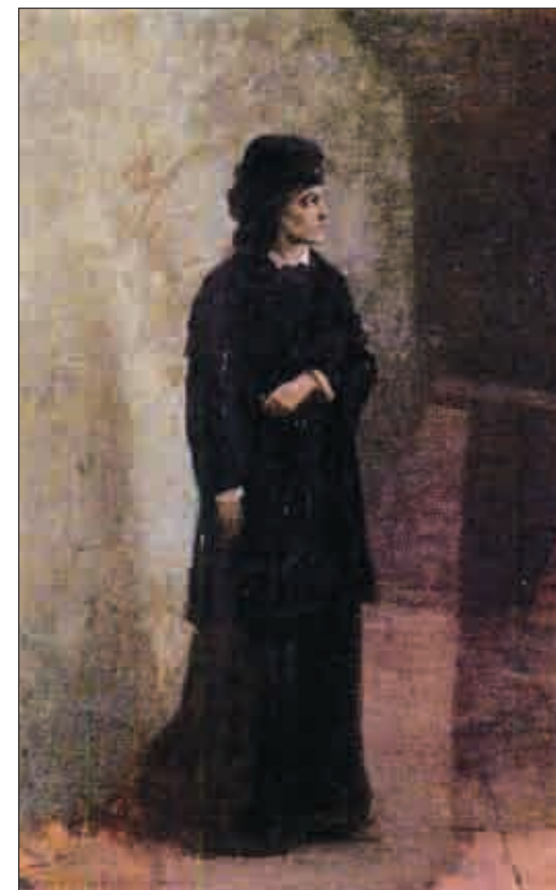
Н. А. Ярошенко. Террористка. Холст, масло. 1881 год