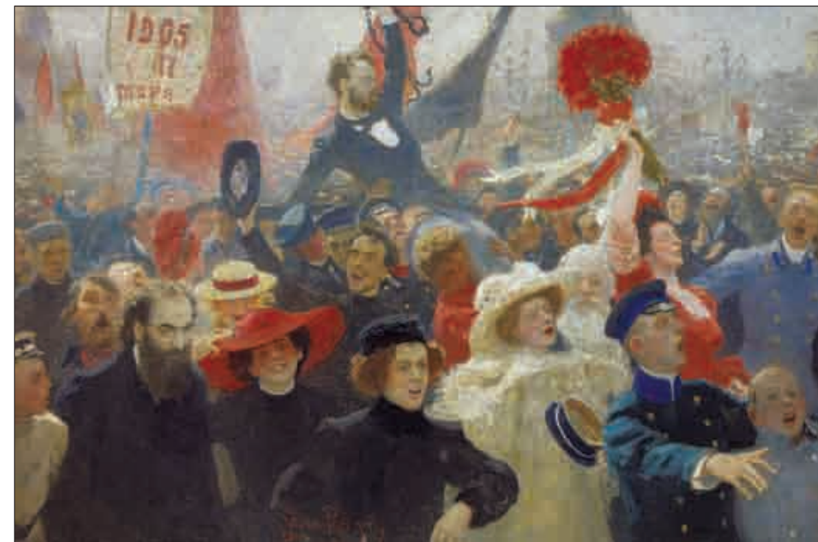
И. Е. Репин. Манифестация 17 октября 1905 года (фрагмент). Холст, масло. 1907–1911 годы