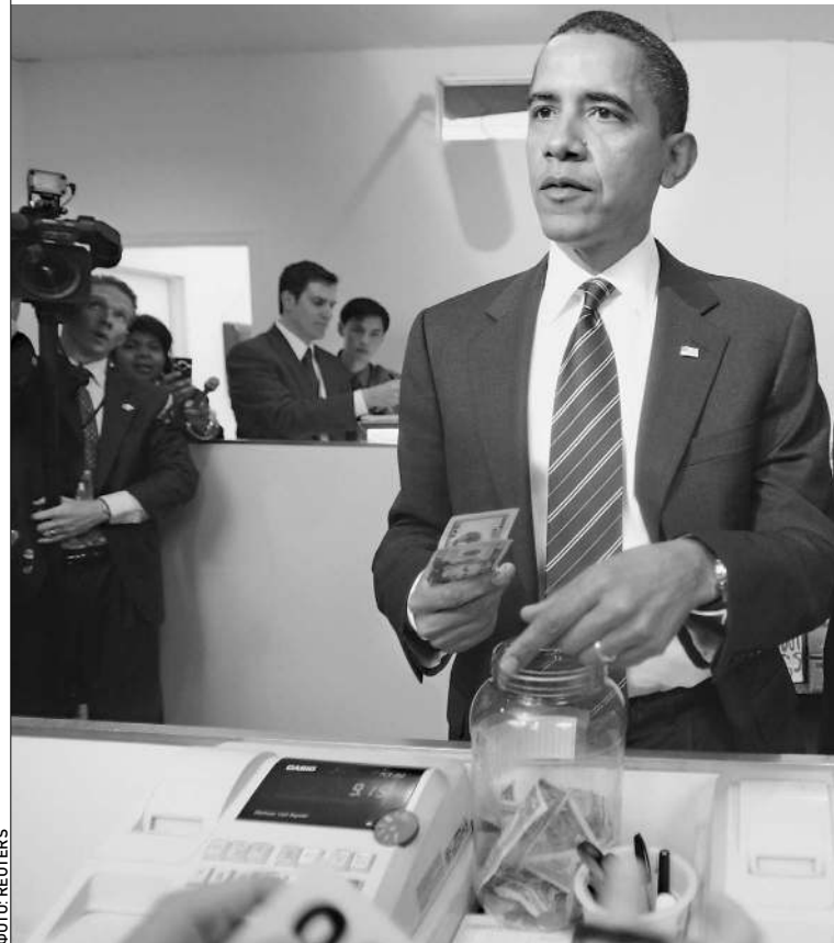
ПРЕЗИДЕНТ США готов поделиться своими доходами с малоимущими американцами

себя в лучших традициях Робин Гуда: взять у толстосумов и отдать бедным. Барак Обама — не исключение. Правда, в отличие от благородного разбойника из Локсли, начал он со второго пункта программы. А теперь взялся за первый. → стр. 6