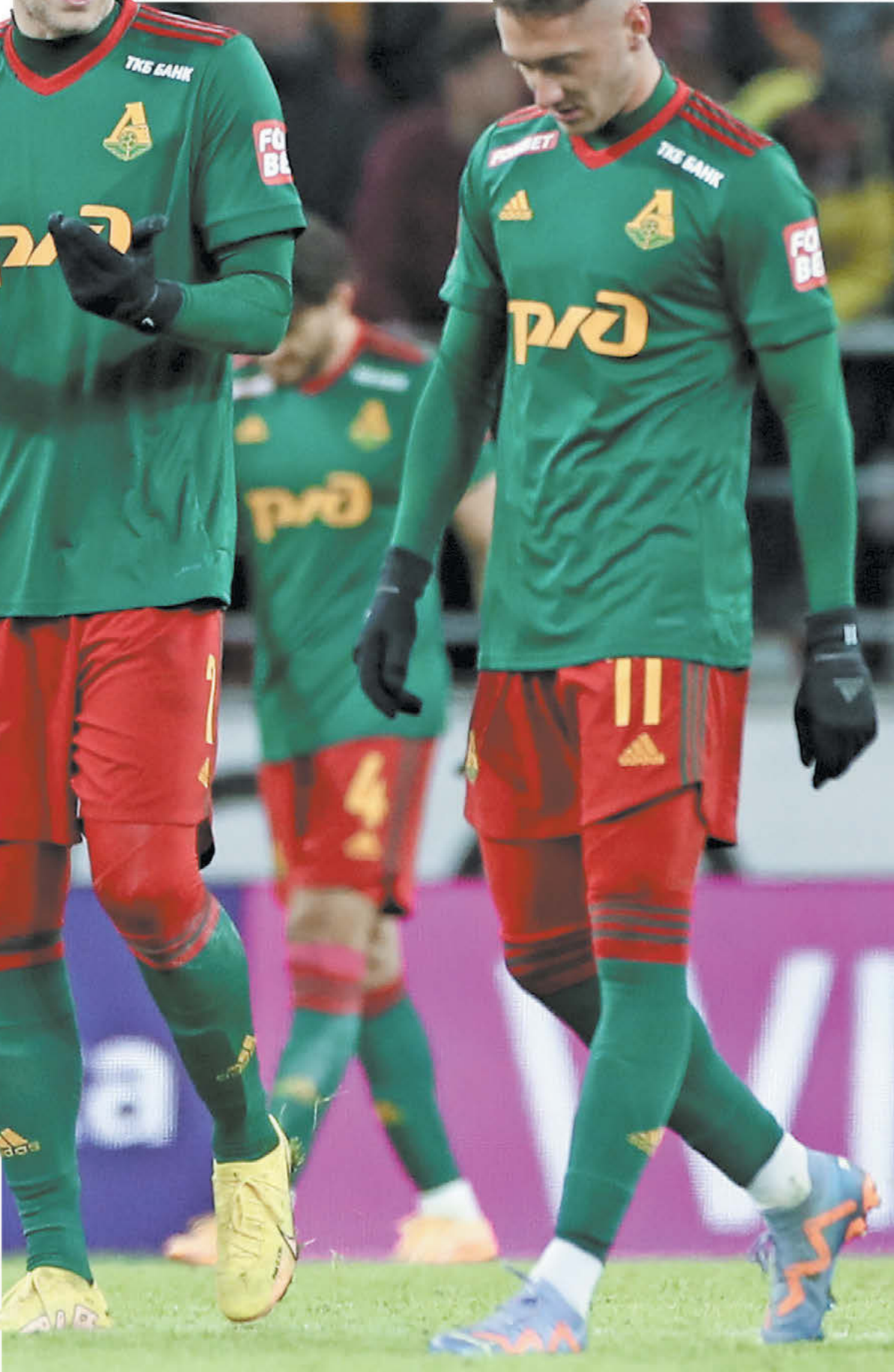
Артем Дзюба и Антон Миранчук покинули «Локомотив»