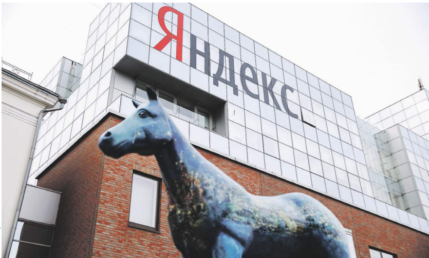
Михаил Терещенко / «Известия»

Изменения в «Яндексе» вернули его котировки на уровень июля