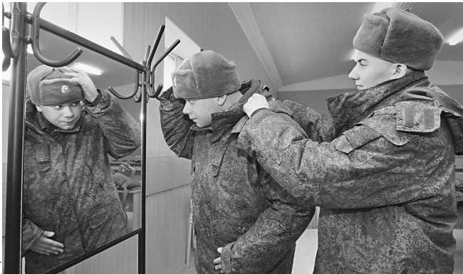
Армейских модников ждут обновки

Он добавил, что в новой форме полностью исключен подворотничок. — Подшивать подворотнички — это, конечно, давняя традиция, но на сегодня это лишняя трата времени и материала. Шею, что ли, сложно помыть, — объяснил собеседник «Известий» логику нового военного руководства. Кроме того, сейчас решается вопрос о переносе погона со зна-