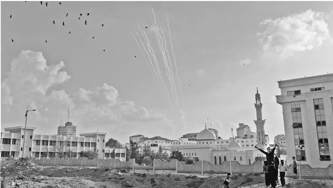
Арабо-израильский конфликт разгорается. Ракетные обстрелы становятся все более интенсивными