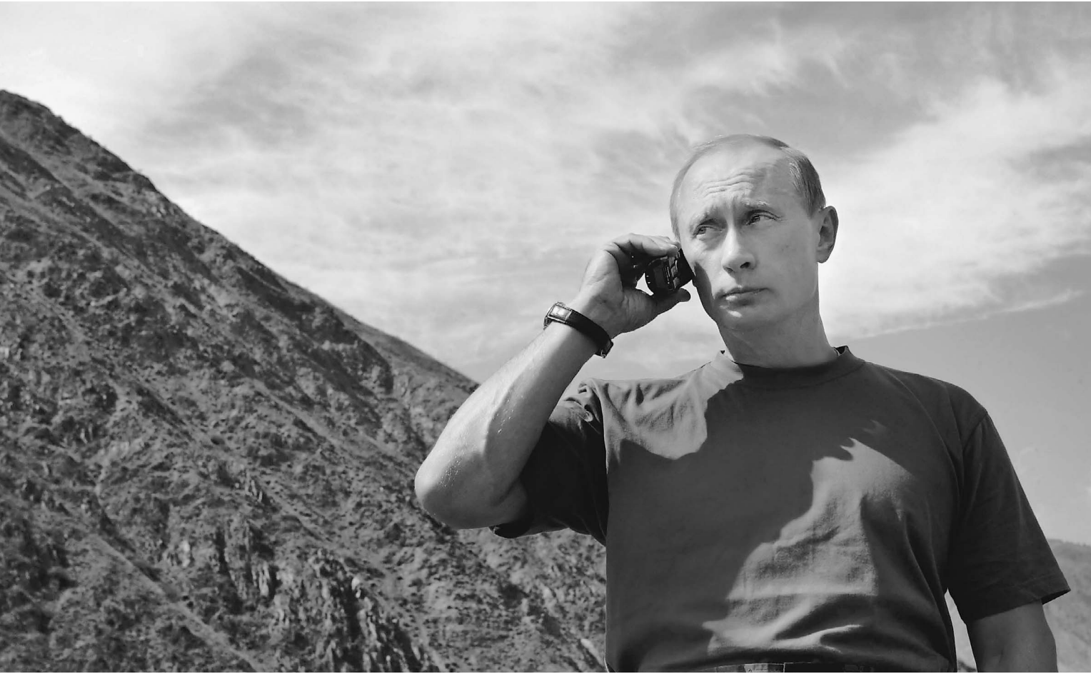
Связь должна быть доступной даже в самых отдаленных районах нашей страны, решил Владимир Путин

«Большая тройка» сотовых операторов наконец-то снизит тарифы на роуминг в разы