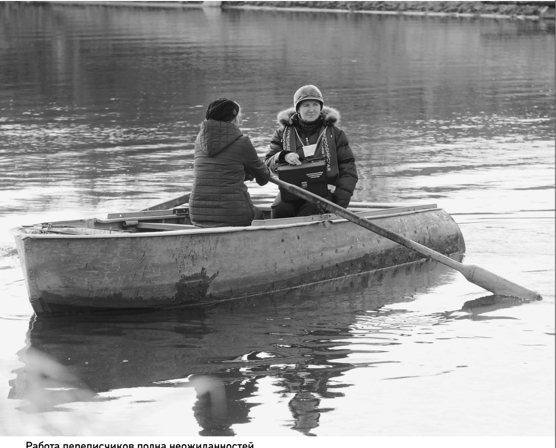
Работа переписчиков полна неожиданностей

ОФИЦИАЛЬНЫЕ (ЦЕНТРАЛЬНЫЙ БАНК РФ) КУРСЫ ВАЛЮТ К РУБЛЮ НА 21 ОКТЯБРЯ