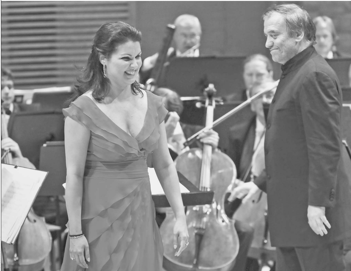
Валерий Гергиев доволен лучшей певицей Мариинки

На XVII фестивале «Звезды белых ночей» выступила Анна Нетребко — оперная суперзвезда, каждый выход которой лишает покоя не только меломанов, но и ценителей женской красоты. Естественно, что на концерт певицы в Санкт-Петербурге смогли попасть не все желающие — при том, что место в партере стоило 16 тысяч рублей. → стр. 7