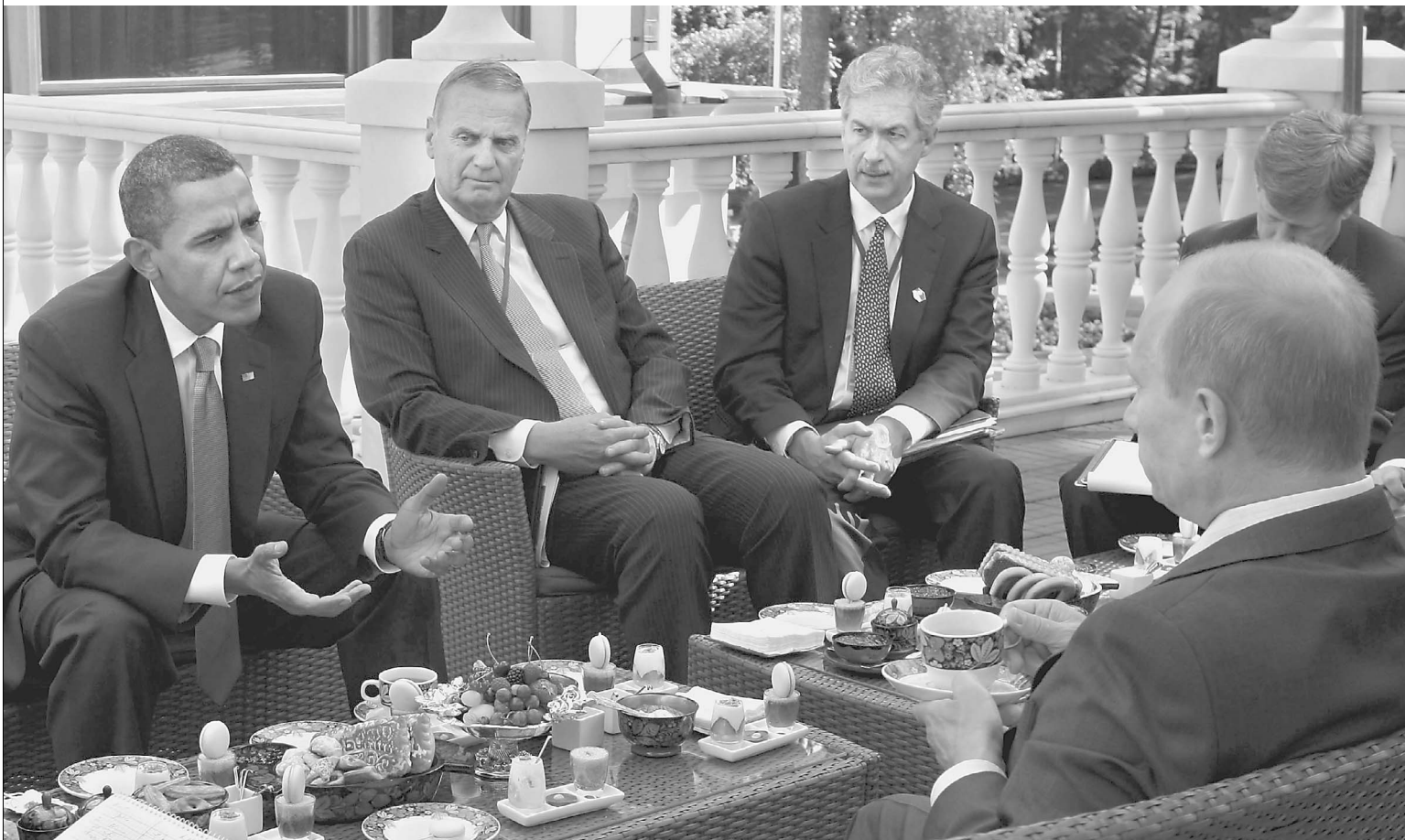
Для БАРАКА ОБАМЫ ВЛАДИМИР ПУТИН устроил «завтрак в русском стиле»

Как американский президент вкусил прелести дачной жизни