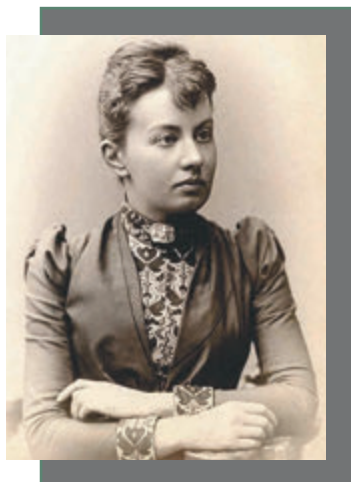
175 лет со дня рождения Софьи Ковалевской