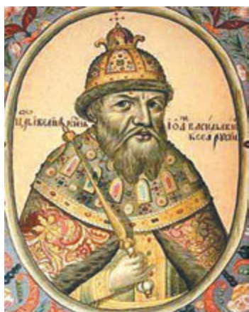
Собиратель земель русских – 585 лет назад родился великий князь Иван III