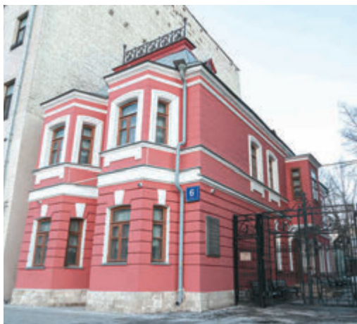
«Дом-комод» – музей А. П. Чехова на Садовой-Кудринской