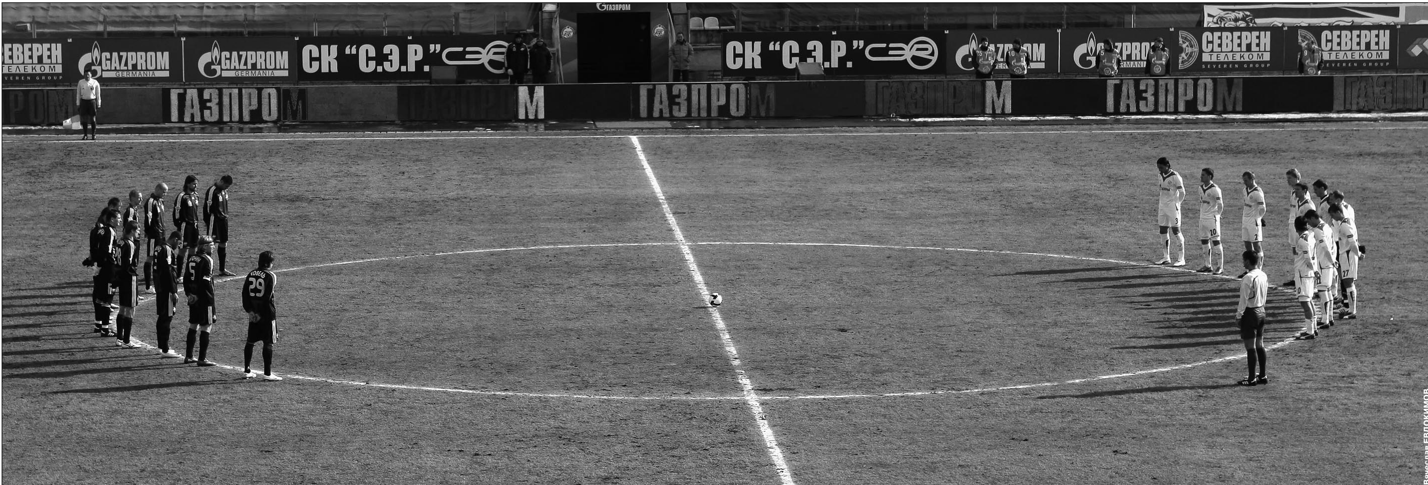
Вчера. Санкт-Петербург. Перед началом матча «Зенит» - «Сатурн». Минута молчания в память о нашем главном редакторе.