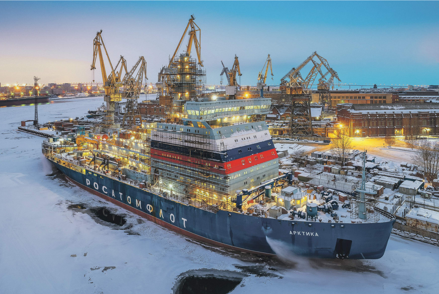
Возможные санкции США против российского судостроения вряд ли смогут сильно ударить по отрасли

Новый законопроект об антироссийских санкциях, внесенный 13 февраля в конгресс сенаторами во главе с демократом Бобом Менендесом и республиканцем Линдси Грэмом, фактически можно назвать ужесточением прошлогоднего пакета под авторством тех же политиков. Он тогда так и не был принят. Нынешний документ «О защите американской безопасности от агрессии Кремля» предполагает ограничения в отношении российских банков, инвестиций в проекты РФ по сжиженному природному газу за рубежом, а также политических деятелей, бизнесменов и членов их семей, связанных, по словам инициаторов, с Владимиром Путиным. Кроме того, предлагаются меры против российского госдолга и кибернетического сектора.