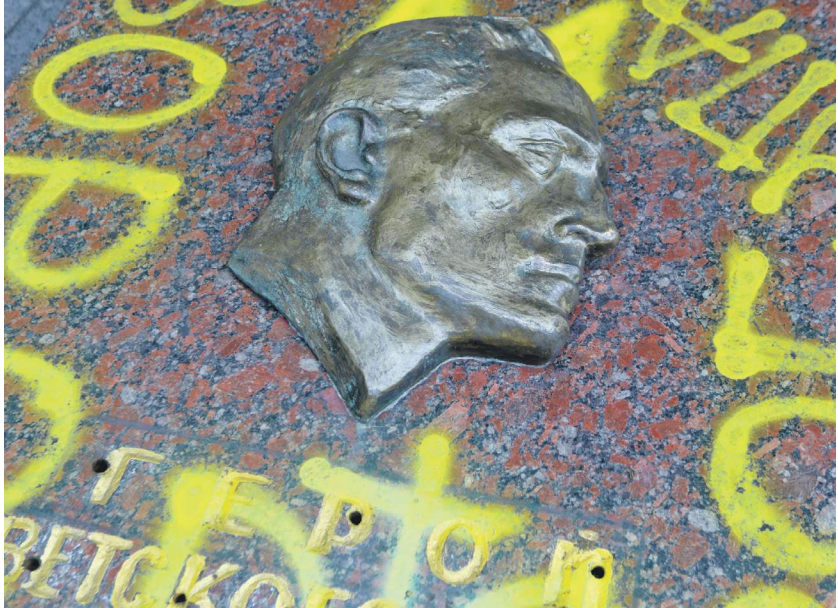
Могила Героя Советского Союза Николая Кузнецова, оскверненная неизвестными (Холм Славы, Львов)