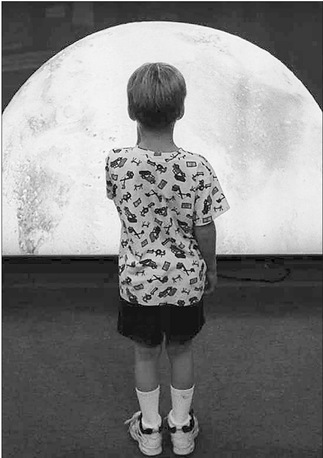
Будем считать, что это Луна

Из США пришло сенсационное сообщение. Досконально изучив прилетевший с Марса метеорит, американские ученые пришли к выводу, что на нем имеются следы жизнедеятельности бактерий. Мало того — они идентичны земным микроорганизмам. Это открытие приближает человечество к ответу на вопрос: «Есть ли жизнь на Марсе?» И хотя наука не имеет границ, от этого успеха становится почему-то грустно. Ибо российская наука взирает на последние достижения мировой науки издалека, как зритель, сумевший устроиться лишь на галерее.