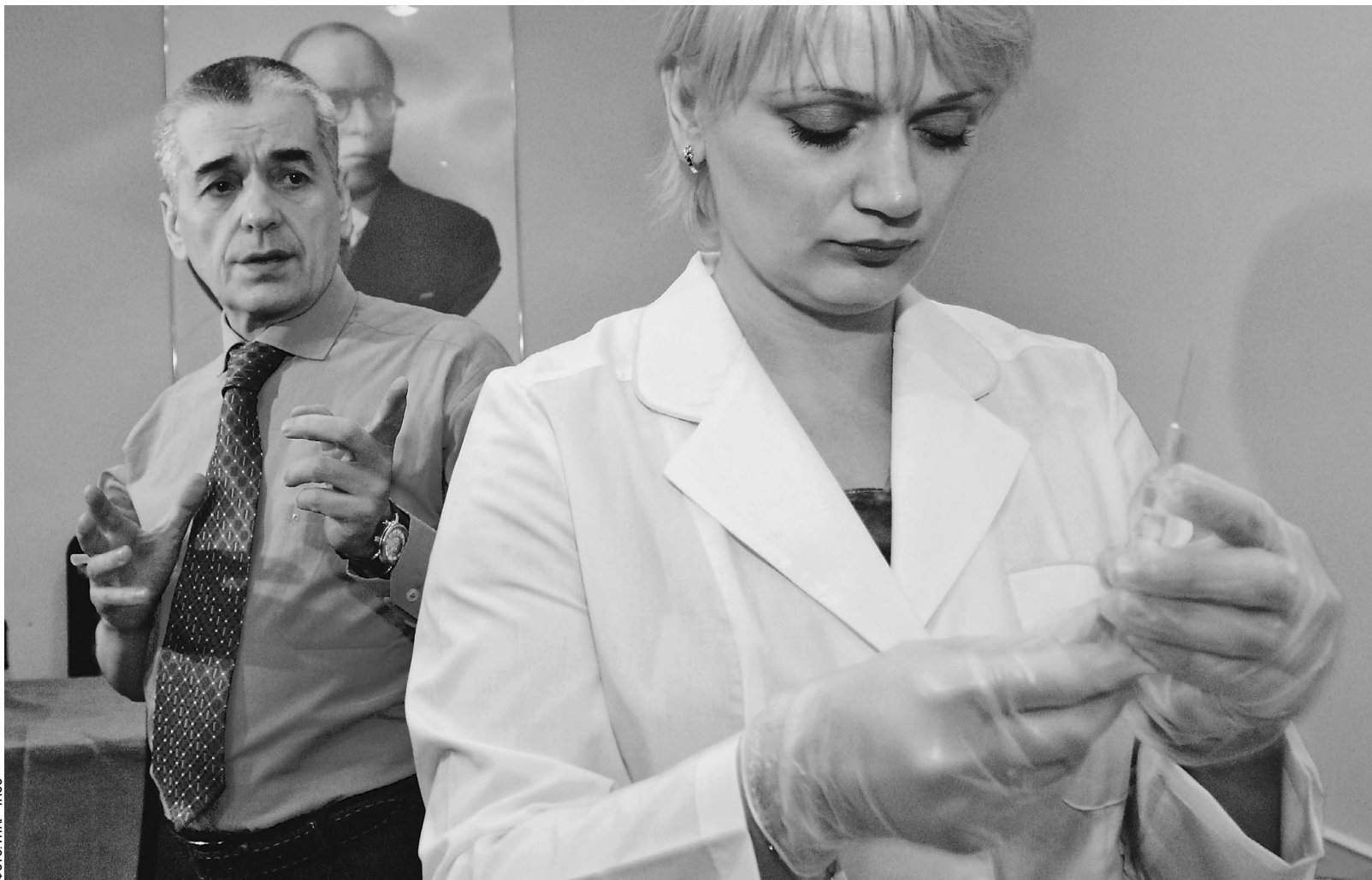
Главный государственный санитарный врач страны Геннадий Онищенко всегда первым доказывает пользу прививок от гриппа

Эпидемия гриппа объявлена уже в 59 регионах