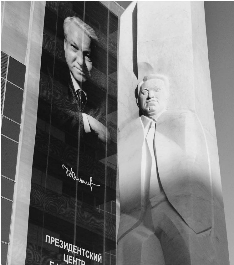
Наина Ельцина: Борису Николаевичу понравилось бы

Памятник первому президенту России открыли в Екатеринбурге. Он стоит на улице Ельцина, напротив бизнес-центра имени Ельцина →02