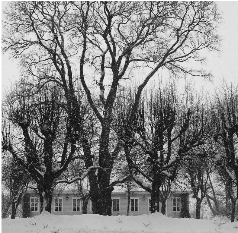
Этот гигантский вяз был посажен Григорием Александровичем Пушкиным