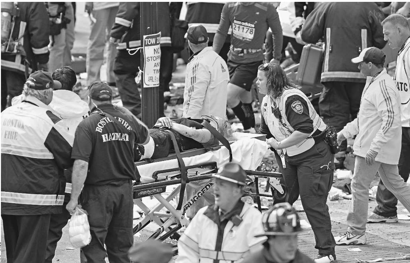
Власти США до сих пор остерегаются называть произошедшее терактом и продолжают подсчет жертв и пострадавших