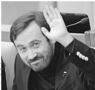
Илья Пономарев забыл о своей инновационной деятельности