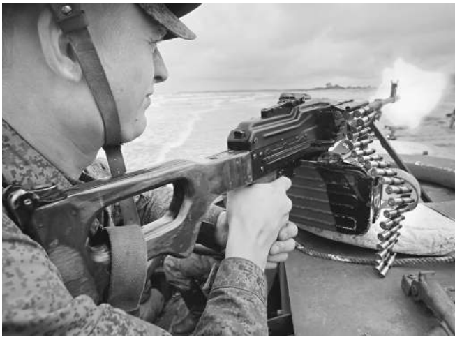
Вести прицельный огонь теперь будут без ущерба для экологии

Он подчеркнул, что в гособоронзаказ на 2013 год стальной трассер не был включен, но сейчас в военном ведомстве ведется корректировка заказа. Масовые закупки новых боеприпасов начнутся в 2014 году, пообещал собеседник «Известий», причем цена вопроса сильно не изменится.