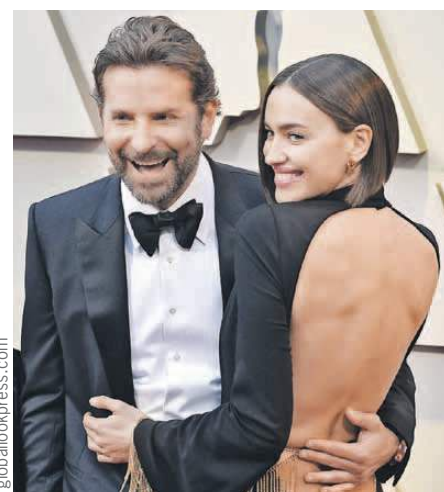
Брэдли Купер и Ирина Шейк.