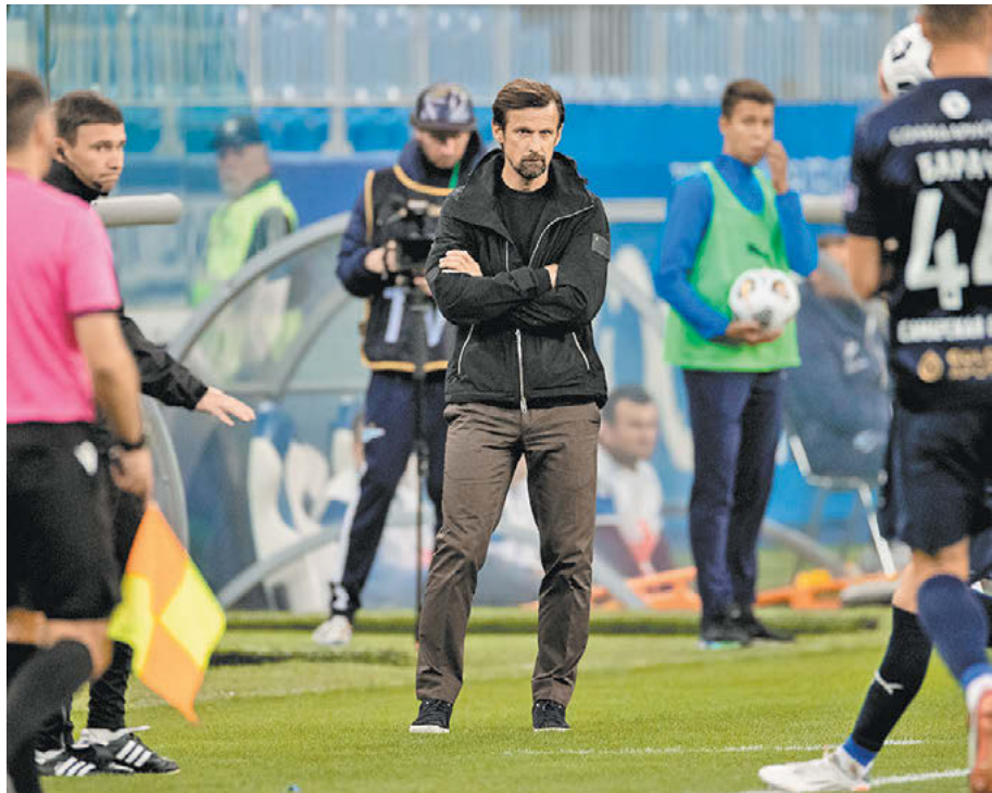
Вчера. Самара. «Крылья Советов» – «Зенит» – 2:0. Главный тренер питерцев Сергей Семак