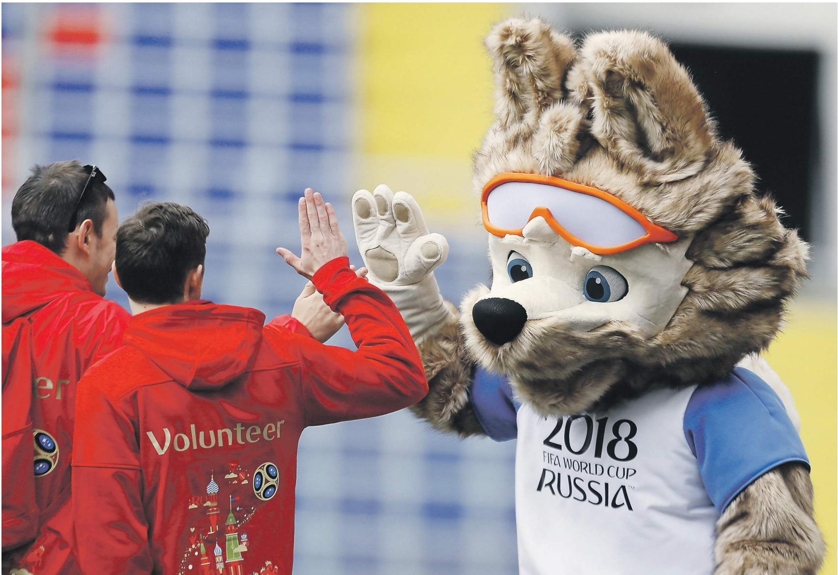
Проведение чемпионата мира по футболу дало импульс производству спортивных товаров