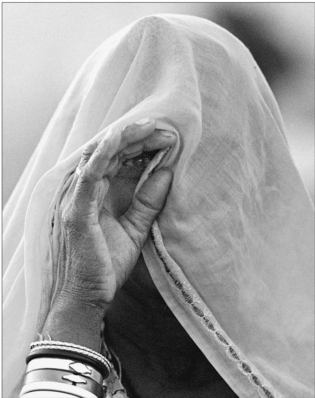
Быют не по паспорту

В России, где было потрачено столько бумаги на агитки и кумача на плакаты о «раз и навсегда решенном национальном вопросе, сегодня на эту тему размышлять также не принято.