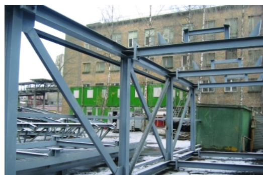
Щуровский цементный завод в Коломне. Изготовление и монтаж металлоконструкций