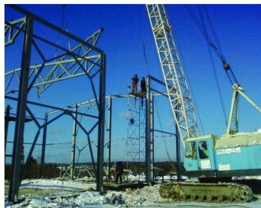
Физкультурно-оздоровительный комплекс с бассейном (пос. Ньюксеница Вологодской обл.). Изготовление и монтаж металлоконструкций каркаса здания и ванны бассейна