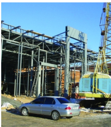
Дилерский центр Мицубиси. Изготовление и монтаж каркаса здания