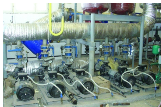
Котельная по ул. Гагарина в Вологде. Монтаж технологического оборудования