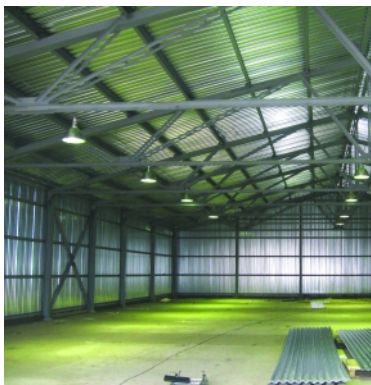
Холодный склад 700 м 2 (Каду́йский винзавод «Арсенал вин»). Изготовление и монтаж м/к