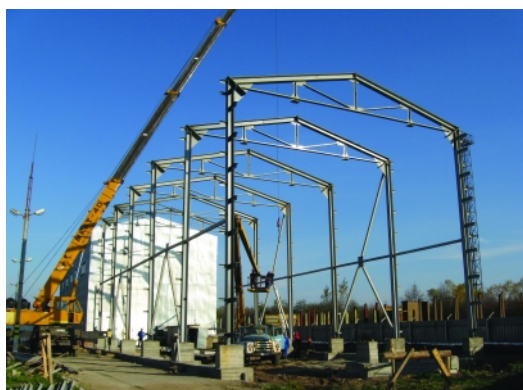
Ремонтно-испытательный пункт подготовки газовых цистерн к ремонту (Вологда). Изготовление и монтаж металлоконструкций здания, монтаж технологического оборудования и трубопроводов