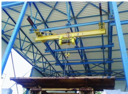
Блок аэрации и ультрафиолетового обеззараживания очистных сооружений Вологды, монтаж металлоконструкций