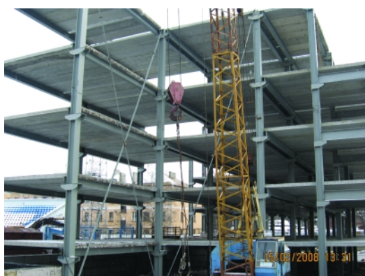
Универсальный комплекс с оздоровительным центром в Вологде. Изготовление и монтаж металлоконструкций