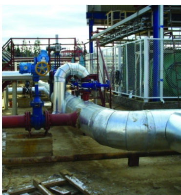
Нефтеналивная эстакада (ст. Ба́кланка Вологодской обл.). Монтаж трубопроводов и технологического оборудования