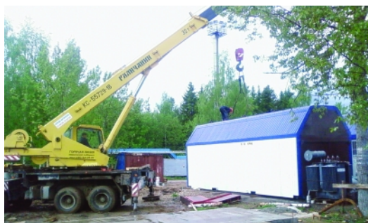
Реконструкция тепловых сетей НПС «Приводино» (Архангельская обл.). Монтаж тепловых сетей и блочной котельной