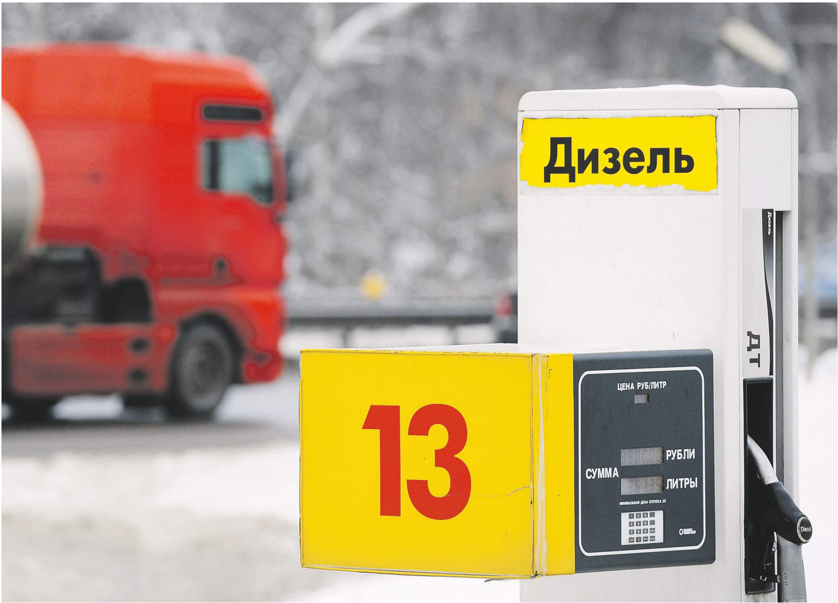
Артём Коротаев / ИКС