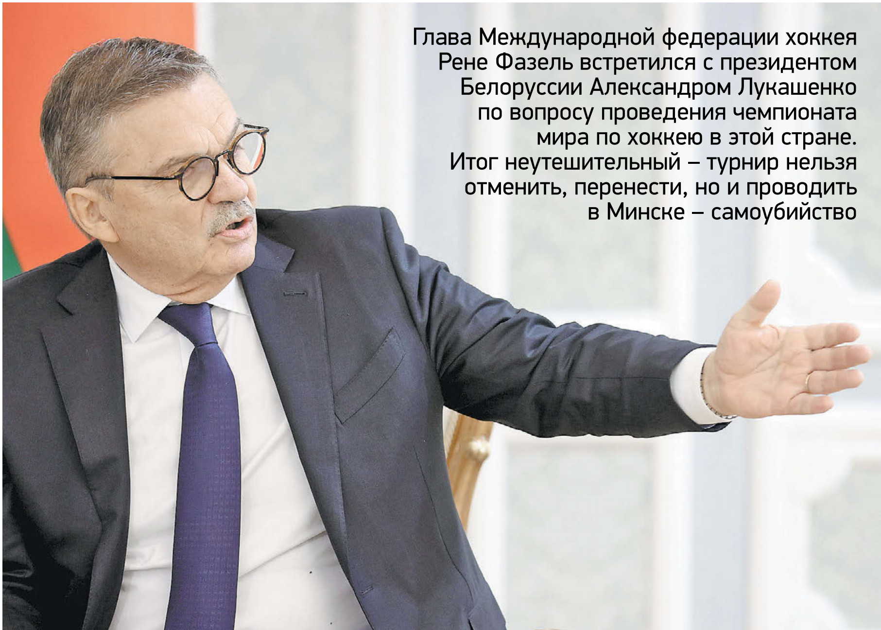
11 января. Минск. Глава Международной федерации хоккея Рене Фазель

Глава Международной федерации хоккея Рене Фазель встретился с президентом Белоруссии Александром Лукашенко по вопросу проведения чемпионата мира по хоккею в этой стране. Итог неутешительный – турнир нельзя отменить, перенести, но и проводить в Минске – самоубийство