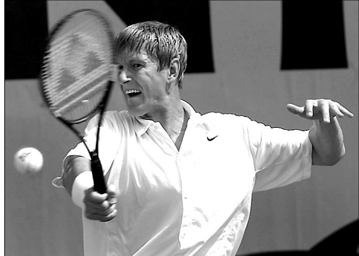
Вчера. Париж. Евгений КАФЕЛЬНИКОВ.

- Можно ли сказать, что вы постепенно справляетесь с теми проблемами, которые преследовали вас в последнее время?