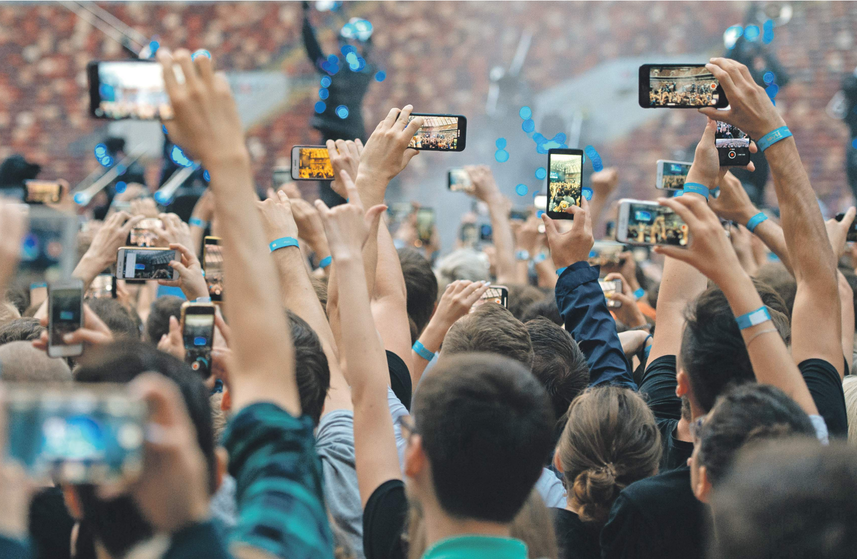
Антон Белицкий / ТАСС

При этом динамика потребления мобильного интернета противоположна динамике спроса на сотовую голосовую связь, следует из материалов министерства. За год продолжитель-