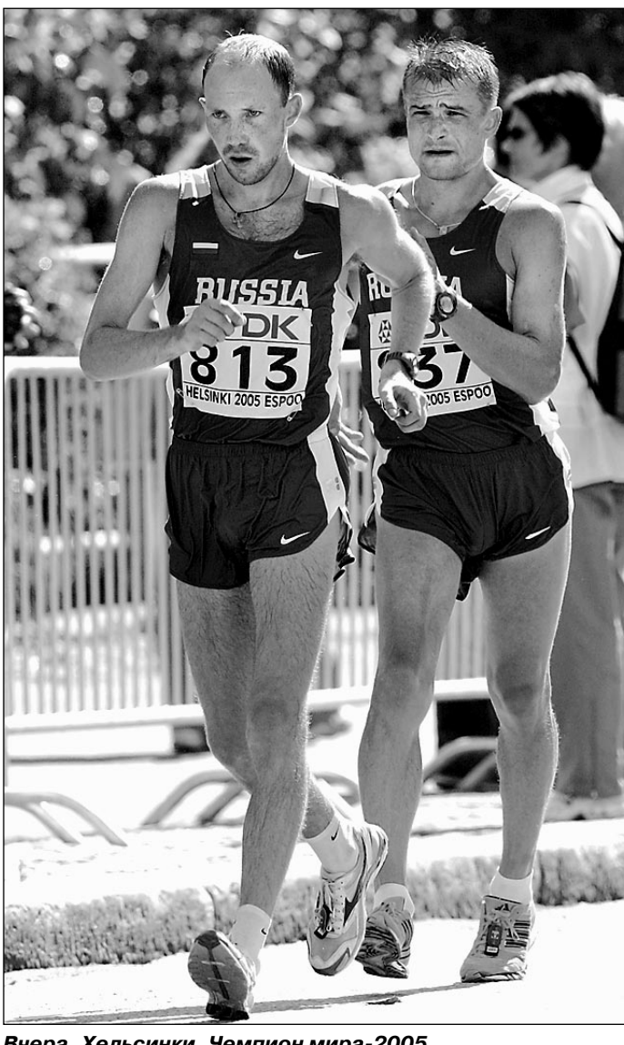
Вчера, Хельсинки. Чемпион мира-2005 Сергей КИРДЯПКИН и серебряный призер Алексей ВОЕВОДИН на дистанции 50 км.