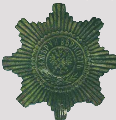
Солдатская кокарда на кивер ▲ 1830—1840-е годы