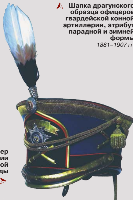
Генеральский кивер лейб-гвардии Конно-артиллерийской бригады ▲