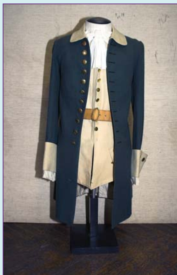
Комплект формы одежды гардемарина образца 1752 г. Реконструкция начала XX в.