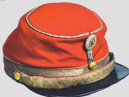
Кепи генерала ▲ 1870-е годы