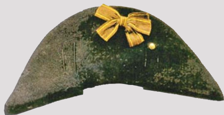
Шляпа офицера пехоты ▲ 1797 г.

К окарда — значок на форменном головном уборе сегодня нам настолько привычна, что мало кто обращает внимание на то, что на ней изображено. Оно и понятно: форменную одежду ныне носят не только военнослужащие, так что различных кокард довольно много. Однако первоначально кокарда являлась привилегией военного человека.