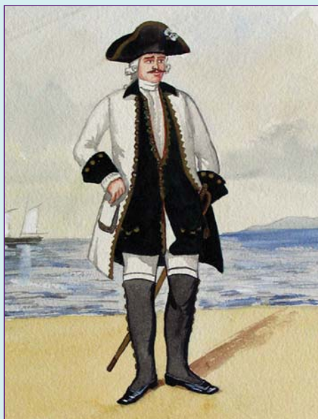
Флота обер-офицер в строевой форме образца 1745 г. Акварель