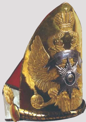
Гренадёрская шапка лейб-гвардии Павловского полка ▲

Об истории появления и пути трансформации военной кокарды в знак строго установленного образца, какой мы видим на головных уборах наших военнослужащих, читайте в номере статью И.В. Зимина «Кокарда в русской армии. 1731—1918 гг.».