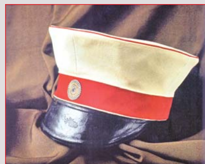
Фуражка кавалергардского офицера. Матерчатая гофрированная трёхцветная кокарда 1860-е годы ▲