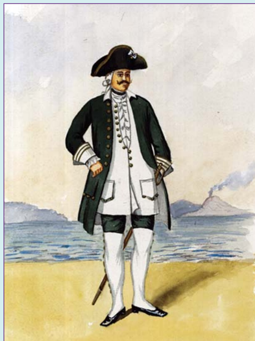
Подштурман в мундире образца 1748 г. Акварель