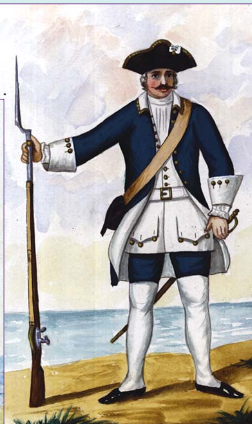
▲ Гардемарин в мундире образца 1752 г. Акварель