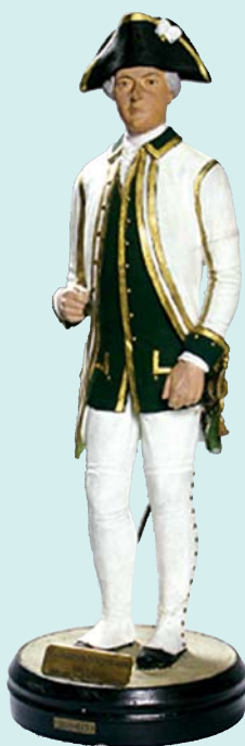
▲ Флагман в мундире образца 1745 г. Статуэтка

Публикацию подготовили А.А. ТРОНЬ и А.В. АНАНЬИН