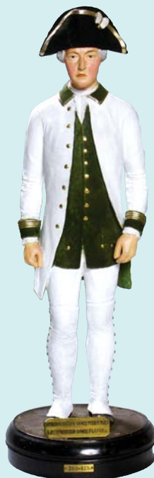
Мичман унтер-офицерского ранга и штурманский офицер в мундире образца 1748 г. Статуэтка