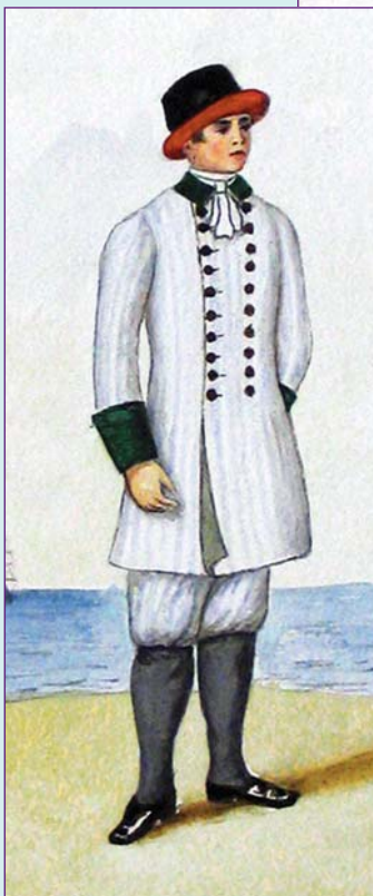
Матрос (в кафтане канифасном образца 1748 г.) Акварель ▲