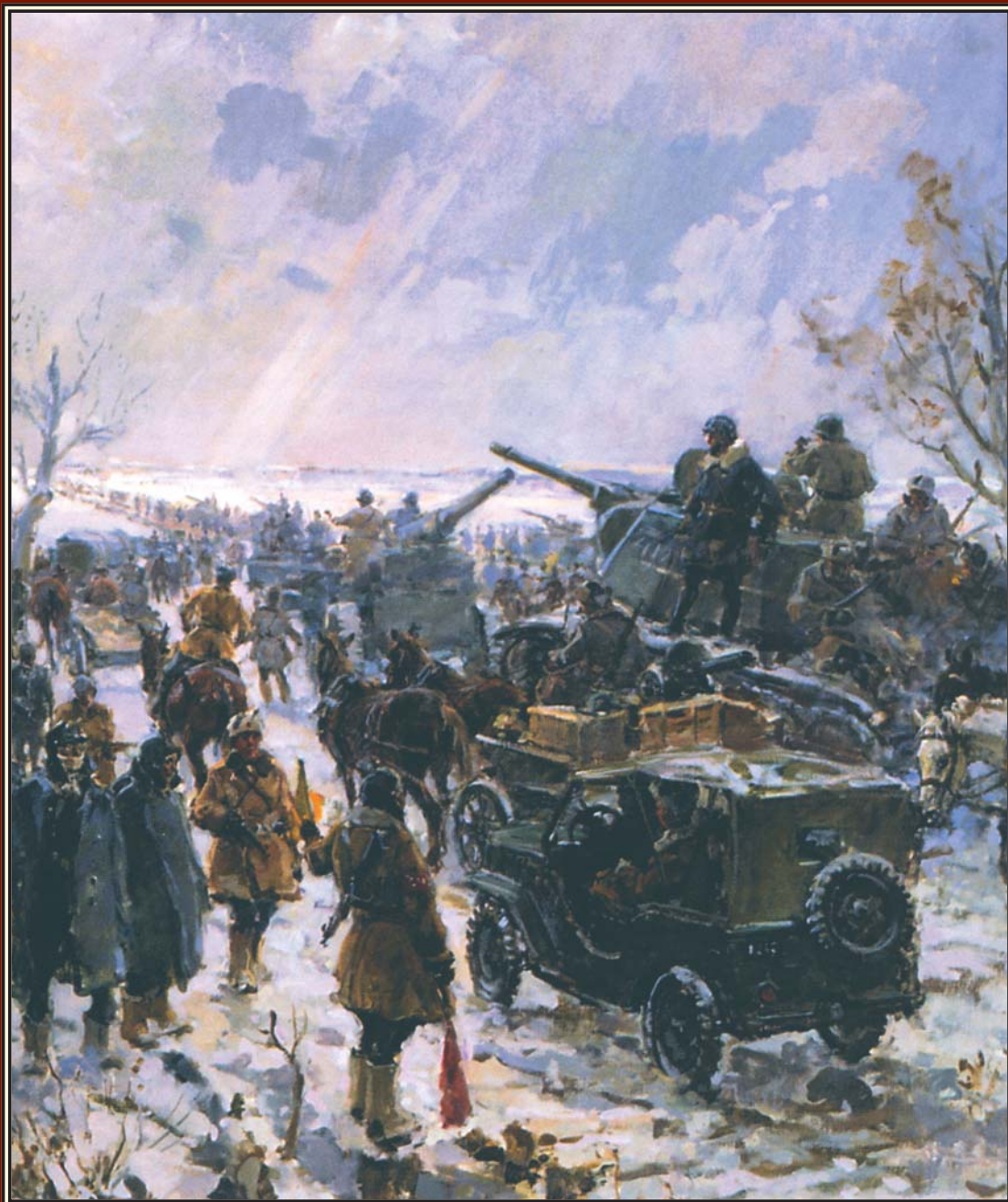
Переправа под Сталинградом Художник Г.К. САВИЦКИЙ

18 апреля — День победы русских воинов князя Александра Невского над немецкими рыцарями на Чудском озере (Ледовое побоище, 1242 г.) День воинской славы России