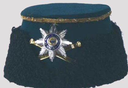
▲ Шапка драгунского образца офицеров гвардейской конной артиллерии, атрибут парадной и зимней формы 1881—1907 гг.