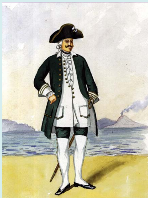
▲ Флота штаб-офицер в парадной форме образца 1745 г. Акварель