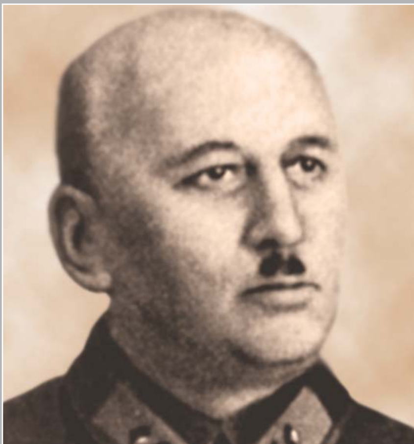
СВЕЧИН Александр Андреевич (1878—1938)