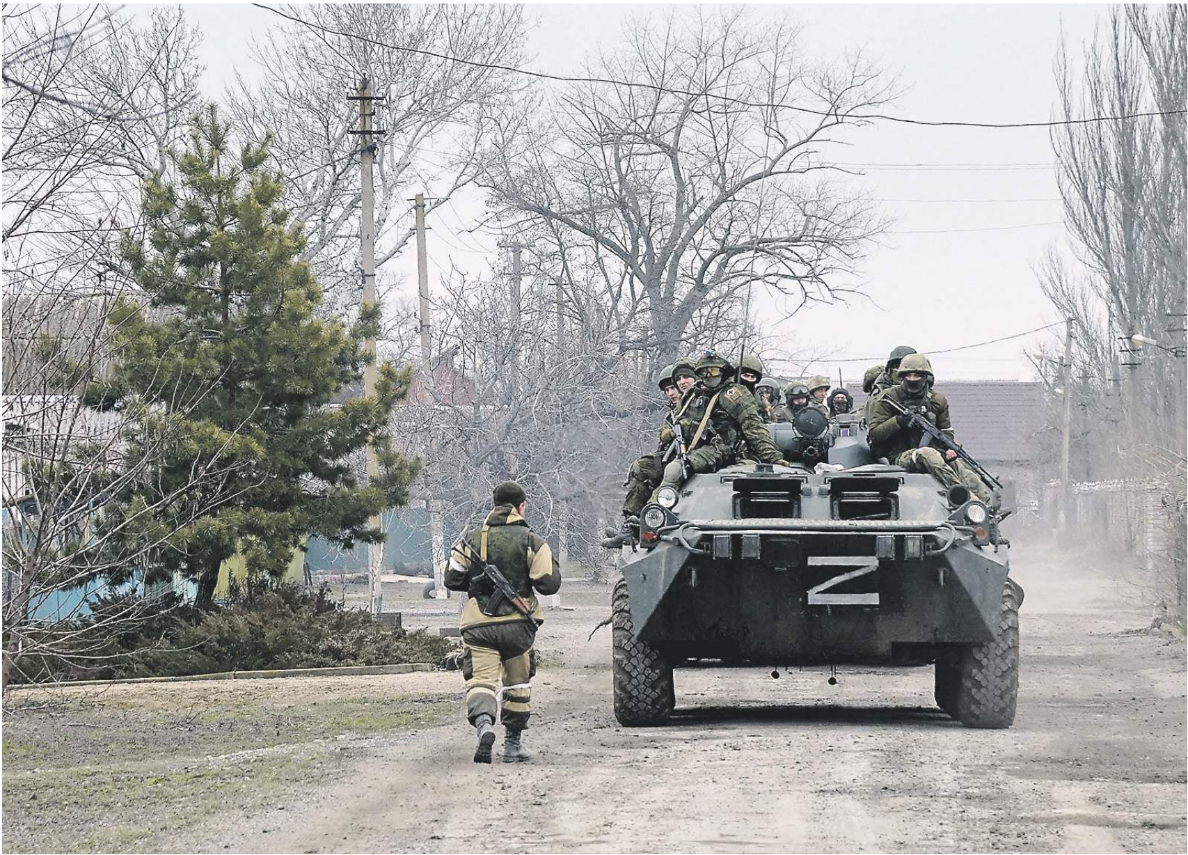
Киев, Романов / РИА Новости

Во вторник, 1 марта, войска Донбасса соединились с наступающей из Крыма российской группировкой и замкнули кольцо вокруг Мариуполя. По мнению экспертов, это лишает украинское командование наиболее сильной и боеспособной части своих вооружённых сил, что в итоге положительно скажется на сроках проведения спецоперации. Штаб оперативно-тактической группировки «Север» ВСУ в результате удара потерял большинство офицеров. Глава Минобороны РФ заявил: операция будет продолжена до достижения поставленных целей. 1 марта передовые отряды Донецкой народной республики вышли к своей административной границе и соединились с российскими частями, которые взяли под контроль районы вдоль побережья Азовского моря. После этого доступ украинским вооружённым силам к Азовскому морю был полностью заблокирован, сообщили в Минобороны РФ. По данным военного ведомства, 1 марта войска ДНР вели успешное наступление, взяв под контроль населённые пункты Ивановка, Талаковка, Стародубовка, Берестовое, Белоцерковка. Глубина продвижения группировки за прошедшие сутки составила 19 км. — Окружение российской группировки под Мариуполем означает, что Украина потеряла наиболее важную и боеспособную часть своих вооружённых сил, — сказал «Известиям» директор Центра комплексных европейских и международных исследований НИУ ВШЭ Василий Кашин.