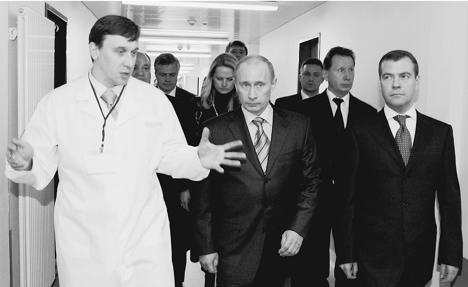
Бесконечный коридор медицинских проблем ПРЕЗИДЕНТ И ПЕРВЫЙ ВИЦЕ-ПРЕМЬЕР теперь проходят вместе

Когда по всей стране появятся высокотехнологичные медицинские центры?