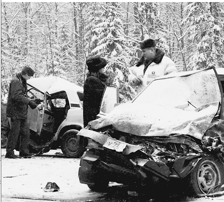
С введением новых штрафов и арестов АВАРИЙНОСТЬ НА ДОРОГАХ резко пошла на спад

ся корреспондент «Известий» Юрий Николаев и убедился: у юноши от славы голова не кружится. вопрос: Правда ли, что именно знаменитый дед подарил тебе первые коньки? ответ: Да, в три года; я в них по дому ходил. Не снимал даже, когда спать ложился. Так продолжалось, наверное, месяца два. Только потом я в них на лед вышел. → стр. 11