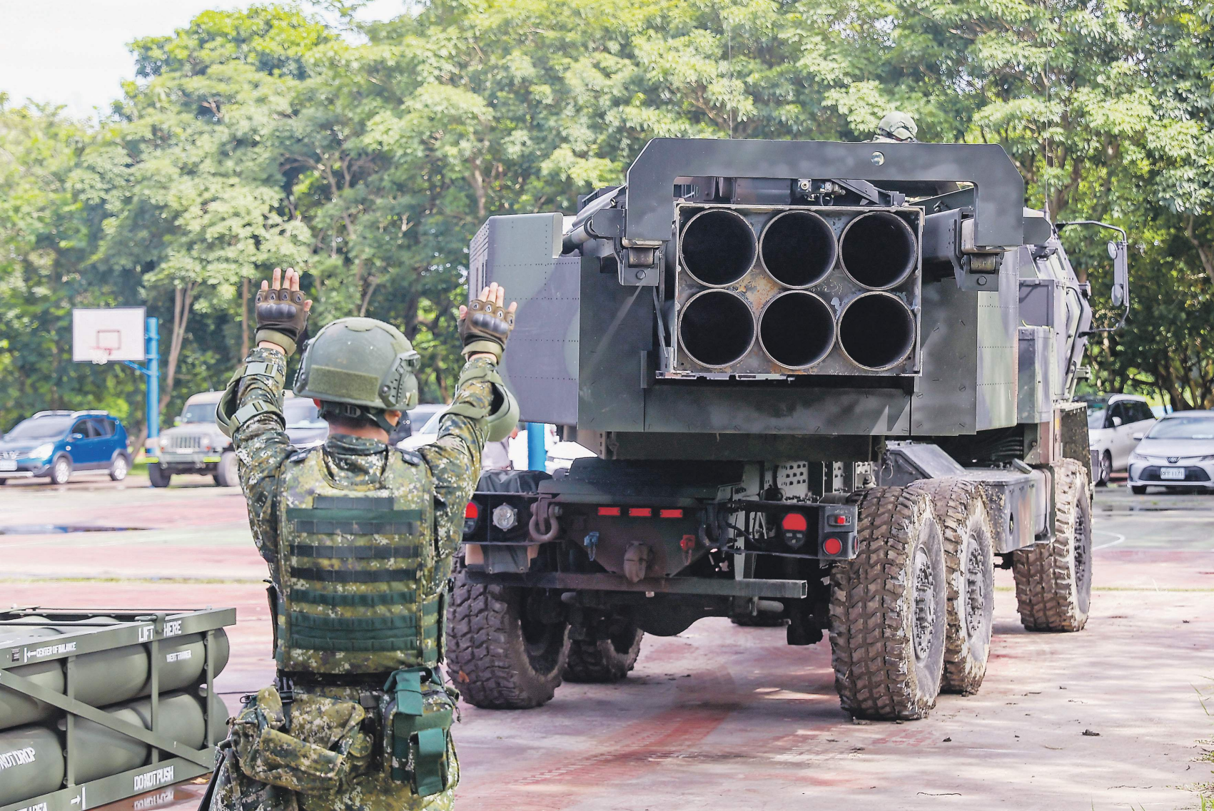
Первую партию установок Patriot из 17 единиц Киев должен получить в течение нескольких дней

14 июля Дональд Трамп заявил, что США отправят системы ПВО Patriot на Украину за счёт Евросоюза. Помимо этого Вашингтон собирается оказывать давление на Россию и с экономической стороны. Трамп объявил, что США введут стопроцентные пошлины на товары из России, если в ближайшие 50 дней не будут достигнуты договорённости по Украине. По оценкам аналитиков The New York Times, подобные тарифы всё же вряд ли будут введены, так как они нанесут колоссальный ущерб экономике США и спровоцируют конфликт с Китаем. Так или иначе, заявления главы Белого дома не остались незамеченными в Кремле. Пресс-секретарь президента РФ Дмитрий Песков назвал угрозы Дональда Трампа «весьма серьёзными»: «Что-то в них адресовано лично президенту Путину. Нам, безусловно, нужно время для анализа сказанного в Вашингтоне».