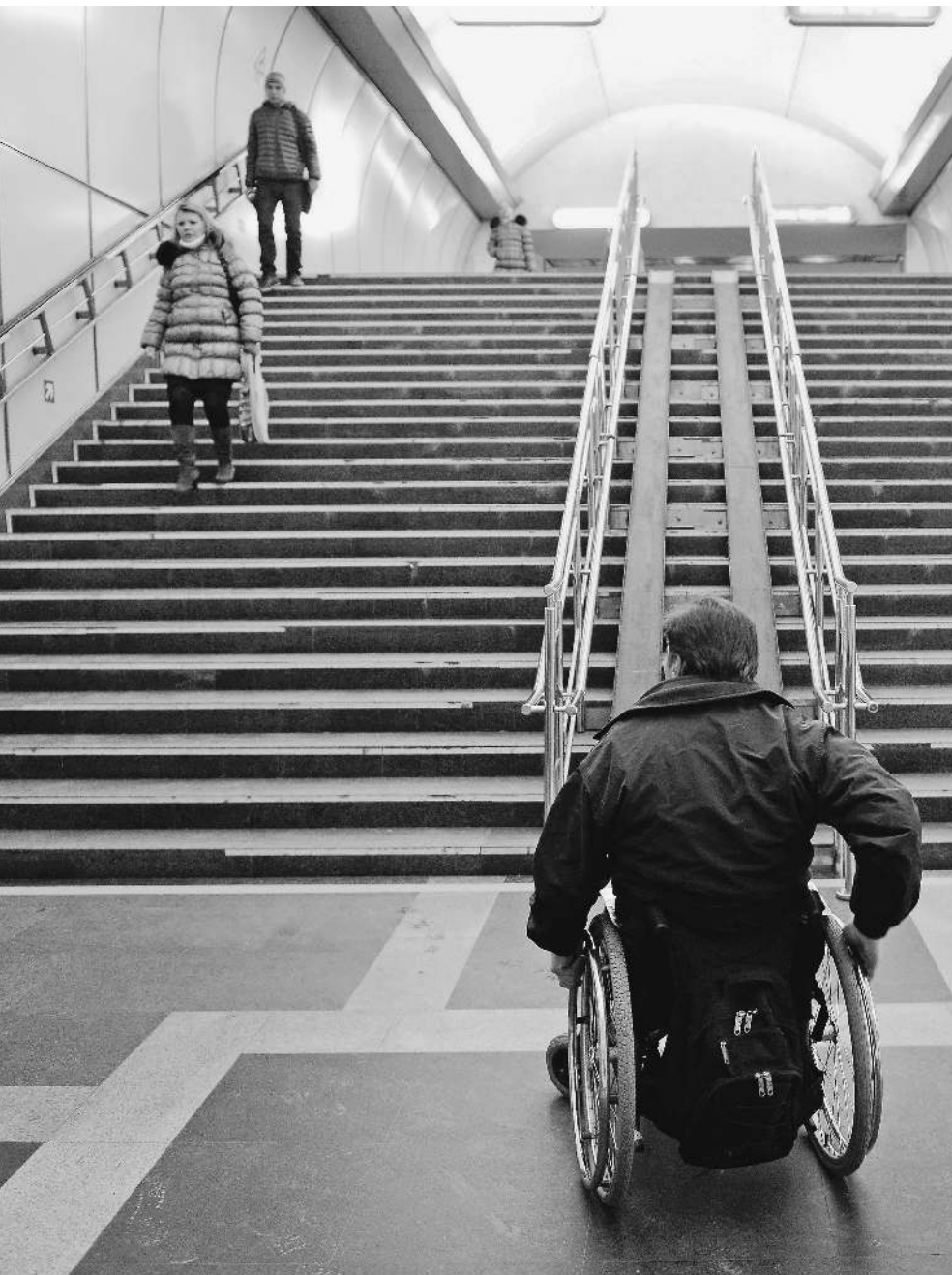
Со многими проблемами инвалидам опять придется справляться самостоятельно