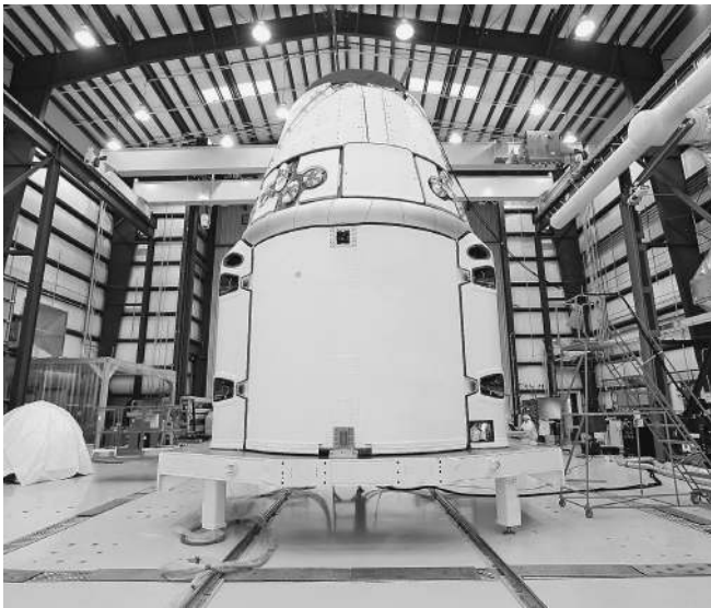
Dragon оказался солидным конкурентом

Глава РКК «Энергия» не смог конкретизировать стоимость «Прогресса» — по его данным,