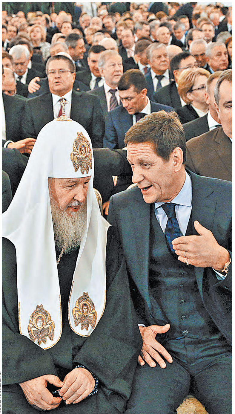
Патриарх Кирилл и 1-й вице-спикер Госдумы Александр Жуков в ожидании президентского Послания.