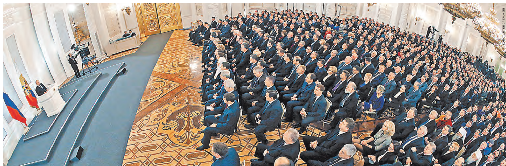
Президент в своем Послании к Федеральному Собранию пообещал не повышать налоги и провести амнистию капитала, чем вызвал одобрение зала.

ПРАКТИКУ ежегодных обращений с Посланием ввел первый президент России Борис Ельцин. Впервые он огласил подобный документ 24 февраля 1994 года. Владимир Путин впервые обратился с Посланием к Федеральному Собранию 8 июля 2000 года. За два срока своего пребывания на президентском посту он уже 10 раз исполнял эту миссию. Церемония традиционно проходит в Георгиевском зале Большого Кремлевского дворца.