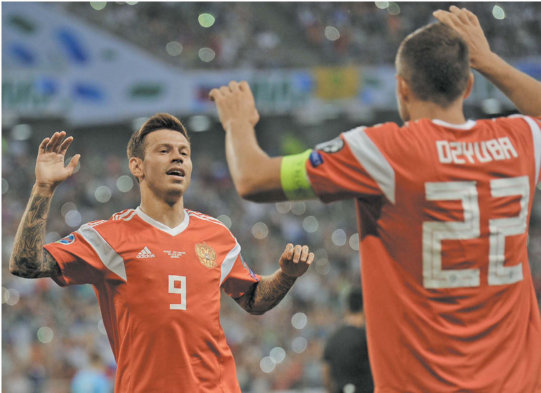
8 июня 2019 года. Саранск. Отборочный матч Евро-2020. Россия – Сан-Марино – 9:0. Нападающие нашей команды Федор Смолов и Артем Дзюба

Вчера главный тренер сборной России Валерий Карпин объявил окончательный состав на отборочные матчи ЧМ-2022 со Словакией (8 октября, Казань) и Словенией (11 октября, Марибор)