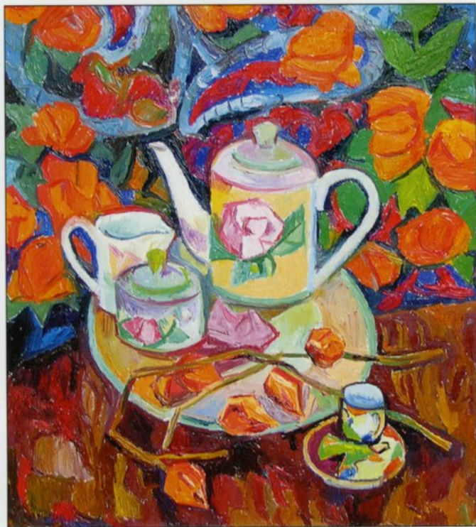
Натюрморт с чайником. Холст, масло. 2008 год