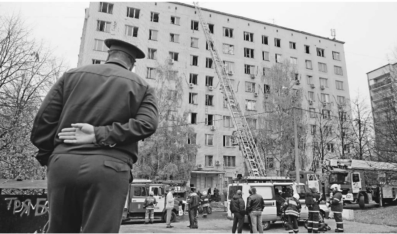
Пока все экстренные службы собираются на происшествие после звонков на привычные, но разные номера