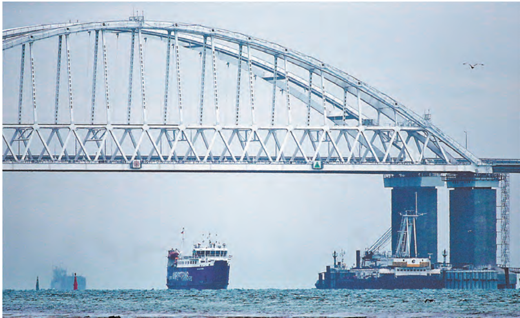
Документальный кадр: дата — 26.11.2018, время — 10.49 мск, суда идут через Керченский без каких-либо помех.

Когда военные моряки Незалежной опасно маневрировали в территориальных водах России, проход по Керчь-Еникальскому каналу перекрывал сухогруз и сторожевые корабли крымского пограничного управления Федеральной службы безопасности. Жители Керчи весь день внимательно с интересом наблюдали с берега за попытками пограничников навести порядок в судовой зоне. Пока конфликт не достиг кульминации, по обеим сторонам от Крымского моста скопилось несколько сотен грузовых судов, шедших в порты России и Украины.