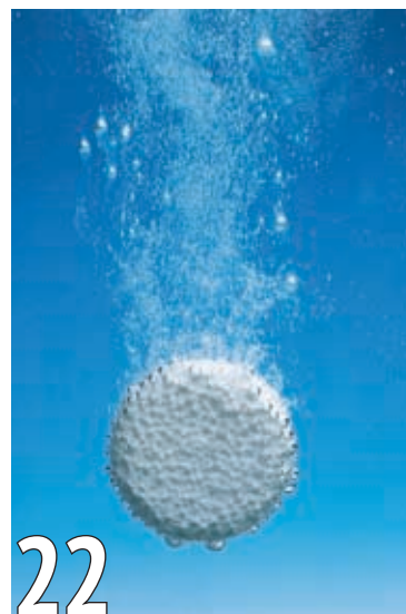
Аспирин: 110 лет открытий и рекордов