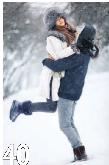
Безопасная помощь при зимних травмах