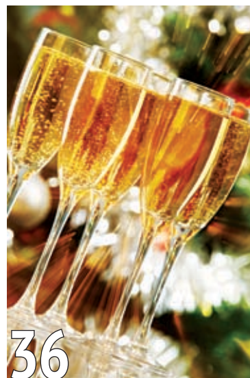
Помогаем печени пережить праздники