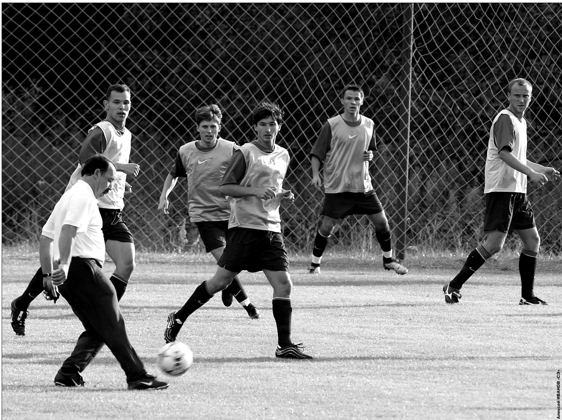
Вчера. Бор. Валерий ГАЗЗАЕВ проводит последнюю тренировку перед дебютным матчем новой сборной России.

В десятилетней истории российского футбола было пять национальных сборных, которые возглавляли Павел Садырин, Олег Романцев, Борис Игнатьев, Анатолий Бышовец и вновь Романцев. Сегодня свой первый матч проведет шестая по счету команда – Валерия Газзаев.